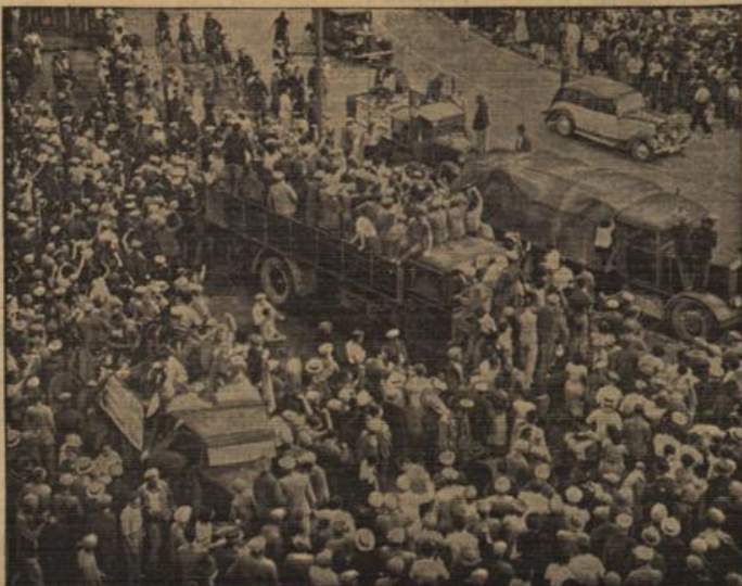
Was das die vielgerühmte Neutralität?

Das Torpedoboot „Wolff“ hat am 2. September 20 Flüchtlinge, darunter 4 Deutsche, nach St. Jean de Luz gebracht.