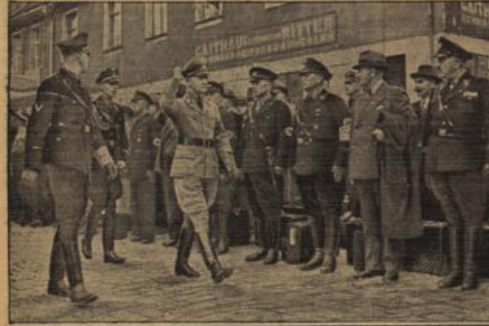
Gauleiter Bohle der Leiter der Auslandsorganisation der NSDAP, schreit hier die Front der auslandsdeutschen Teilnehmer ab.