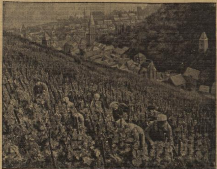
Bald beginnt wieder die Weinfeste.

„Selig Geilbe aber, wo Frucht und Rebe geteilt, Wo das grüne Gewelle weintrunkene Hügel streift, Wo die blonde Beere süßer zur Kelter schwillt, Wo in besüßter Seele alle Gedächtnis gefüllt: Gott krieg selber herab, die Schale in gütiger Hand, Preche die schönste Traube und lächle über das Land...“ (Carnehl.)