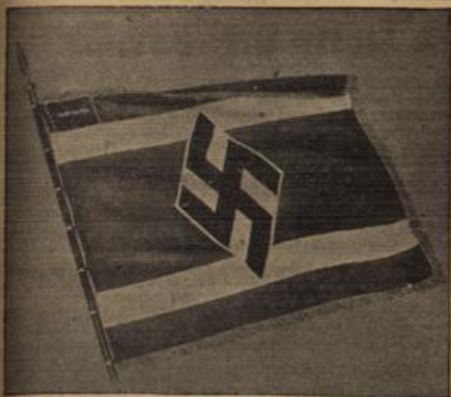
Die Fahne des NSD-Studentenbundes.

Ein schweres Gewitter ging in den frühen Morgenstunden des Freitags über unsere Stadt nieder.