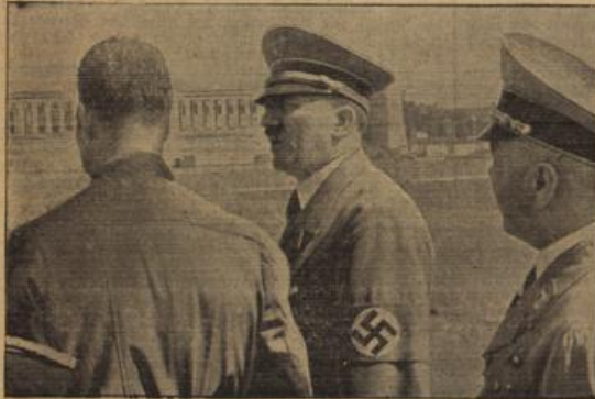
Der Führer besichtigt die Parteitag-Bauten.

Das Haus des Führers am Obersalzberg, ist jetzt vollendet. Inmitten der majestätischen Alpenwelt gelegen, ist das einstige „Haus Wadenfeld“ in vorbildlicher Weise dem Charakter der Landschaft angepaßt. Der „Bergshotel“ soll dem Führer eigentlich als Erholungsstätte dienen, aber auch hier kommen die Staatsgäste nicht zur Ruhe.