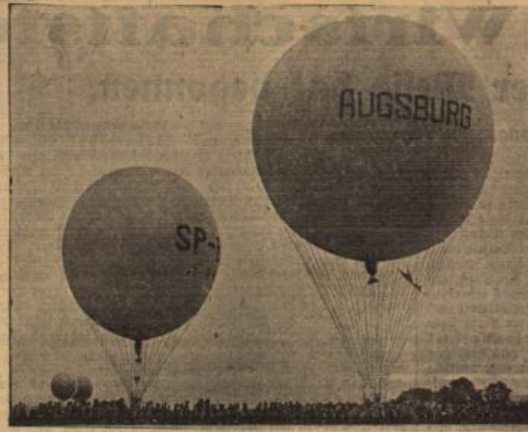
Der Start zum Gordon-Bennet-Rennen.

Impfungen sind alle im Jahre 1935 und früher geborenen Kinder, soweit sie nicht bereits mit Erfolg geimpft worden sind oder nach ärztlichem Zeugnis die natürlichen Blattern überstanden haben, ferner diejenigen Kinder, welche in