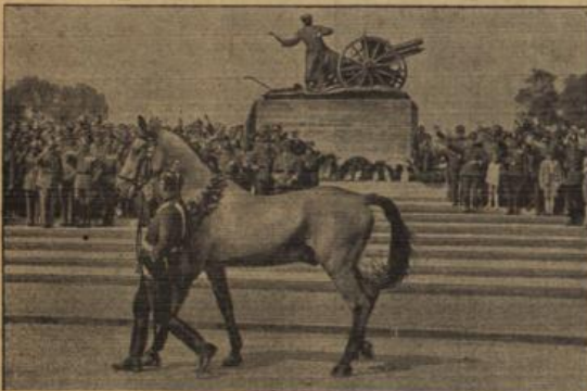
Das Ehrenmal der Feldartillerie.

Bei seinem Besuch in Nürnberg besichtigte der Führer in Begleitung von Rudolf Heß (links) und Dr. Ley (rechts) die neuen großen Bauten auf dem Luftmarschgelände.