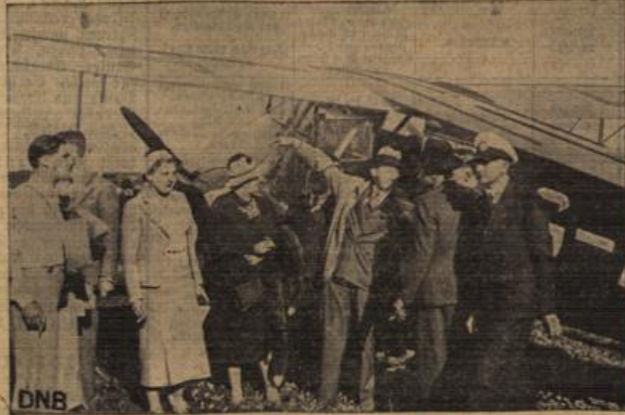
Landung englischer Sportflieger auf dem Flug- und Luftschiffhafen Rhein-Main.

Nach dem Samstagvormittag ist eine Besichtigung des Luftschiffes „Hindenburg“ sowie der Reichsautobahn vorge-