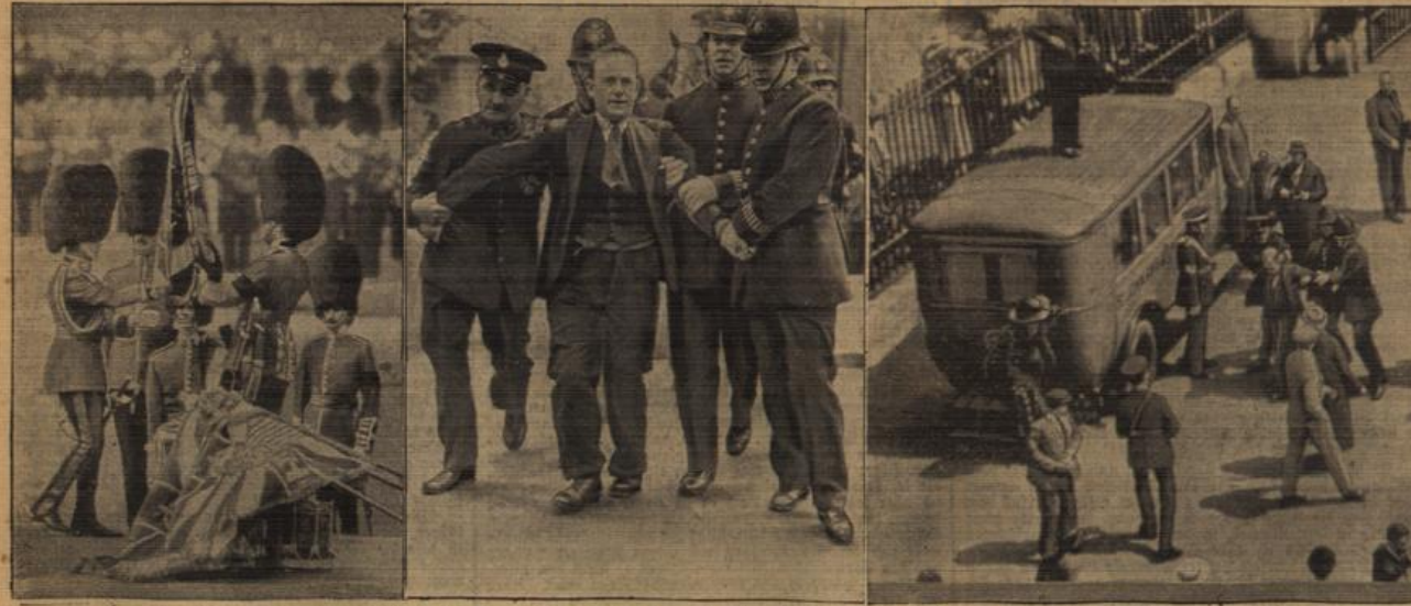
Von links nach rechts: Die militärische Feier im Hydepark vor dem Anschlag. König Eduard (links) bei der Übergabe neuer Fahnen an die Garderegimenter. — Wenige Sekunden nach dem Anschlagsoverlauf. Polizisten haben den Attentäter überwältigt und führen ihn ab. — Der Attentäter wird unter starker Bedeckung zum Polizeiauto gebracht.