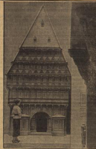
Modell des berühmten Knochenhauer-Armistiums in Hildesheim auf der „Deutschland“-Schau.

Was sollte ich dir eigentlich schreiben? — Ja, du fragst mich, warum ich plötzlich diese Schreibweise bekam? — „Was“ ist wirklich der richtige Ausdruck dafür. Du kannst es an meiner Schrift sehen... daran, daß alle Buchstaben wie bei Kindern vom Schwimmbad in der gleichen Richtung gebogen sind. Höre: Ich habe zu Beginn von einer Rede gesprochen, die ich lange Zeit hindurch ausgedacht hatte... auf die ich aber jetzt verzichte. Doch es ist etwas in dir, was zu deinem Wesen gehört, das möchte ich befehlen, nämlich dein Schweigen. Du verhältst dich richtig! Du hast ein gutes Mundwerk und kannst fundamental mit Gosau über die Führer und den Garten reden. Mit den Kindern — selbst den allerkleinsten — plappert und tollt du ganze Tage lang. Aber auch, wie oft ich mich mit leerem Kopf von Tisch weg! Ich war geplagt von meinen Sorgen und Gedanken und konnte doch mit keinem Menschen darüber sprechen. Besonders seit dem Willenstrog, wo ich seit einem Schlag — mit die Zeitungen sich ausdrücken — ein großer Rechtsanwalt