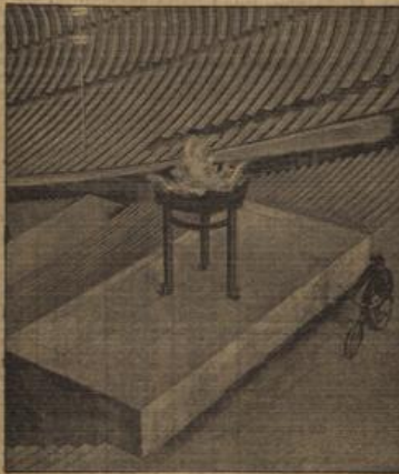
Olympisches Feuer brennt zur Probe.

Genau wie in Berlin, so werden auch in Kiel während der Olympia-Lage Sportler der ganzen Welt im friedlichen Wettkampf freizeiten. Am härtesten besteht die erwartungsgemäß die Olympia-Regatta in der Segler aus 26 Nationen starten. Mit je 13 Rennungen folgen die 6-m-R-Klasse und Starbowl-Klasse und das holländische Feld von zehn Booten tritt zum Kampf in der 6-m-R-Klasse an. Für sämtliche Klassen sind sieben Wettfahrten vorgeschrieben. Jede