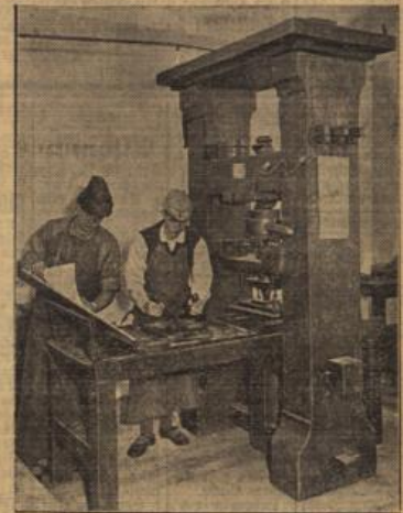
Gutenbergs erste Buchdruckpresse wird auf der "Deutschland"-Schau gezeigt.