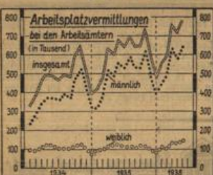
(Graphisch-Statistischer Dienst, M.)

Nach dem Bericht der Reichsanstalt für Arbeitsvermittlung und Arbeitslosenversicherung hat die Bewegung im Arbeitsmarkt im Mai zu einer Abnahme der Arbeitslosen-ziffer um rund 272 000 geführt.