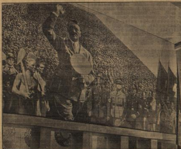
Das Bild des Führers beherrscht die Ehrenhalle der Ausstellung „Deutschland“. In der Ehrenhalle der großen Ausstellung „Deutschland“, grüßt diese überlebensgroße Darstellung des Führers die Besucher.

Es wäre noch vieles zu erwähnen, aber da die Zeit nicht unberücksichtigt bleiben soll, so können nur wenige Dinge der überreichen Ausstellung erwähnt werden.