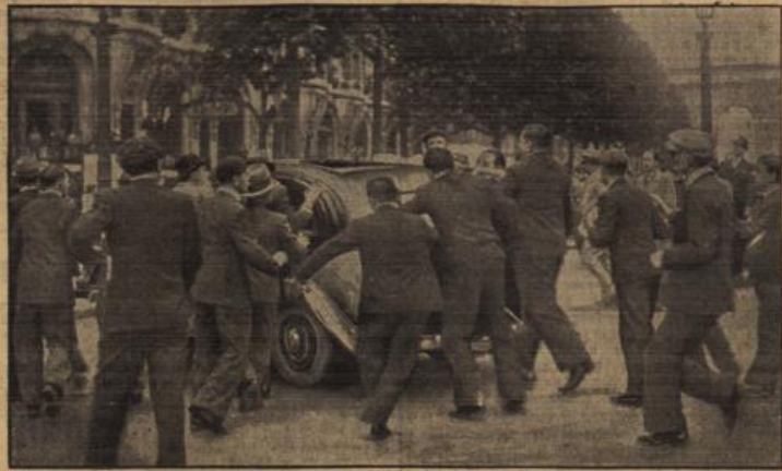
Die Bilanz des 14. Juli in Paris.

Für die Briefmarkensammlung in aller Welt ist die Olympiafahrt des Luftschiffes wieder ein besonderes Ereignis, da die Deutsche Reichspost diese Fahrt zur Postbeförderung freigegeben hat. Die beförberten Briefe und Postkarten erhalten einen Sonderstempel mit der Aufschrift "Luftschiff Hindenburg, Olympiafahrt 1936". Die Gebühren betragen 50 Kpf. für eine Postkarte und 1 RM. für einen Brief bis zu 20 Gramm. Die Sendungen sind in einem Umschlag gegen die gewöhnliche Freigabe rechtzeitig mit folgenden Aufschrift nach Frankfurt a. M. zu senden: "Sendungen für die Olympiafahrt des Luftschiffes "Hindenburg", Bahnpostamt 19, Frankfurt (Main)". Nähere Auskünfte erteilen die Postämter.