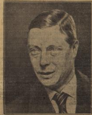
König Eduard VIII.

Der Anschlag, der heute auf Eduard den VIII. verübt wurde, ist glücklicherweise ergebnislos geblieben. Es ist sicher, daß dieser Attentatsversuch, die Sympathien des englischen Volkes für den König nur noch steigern wird, und die ersten Meldungen über Kundgebungen vor dem Buckingham Palace zeigen, daß die Wirkung des Attentats jedenfalls eine ganz andere ist, als der Attentäter es wollte, selbst wenn, wie er jetzt im Verhör behauptet, seine Absicht lediglich die war, einen Protest auf diese Weise zum Ausdruck zu bringen. Es ist selbstverständlich, daß die ganze Welt mit dem englischen Volk darüber empfinden wird, daß dieser Anschlag auf