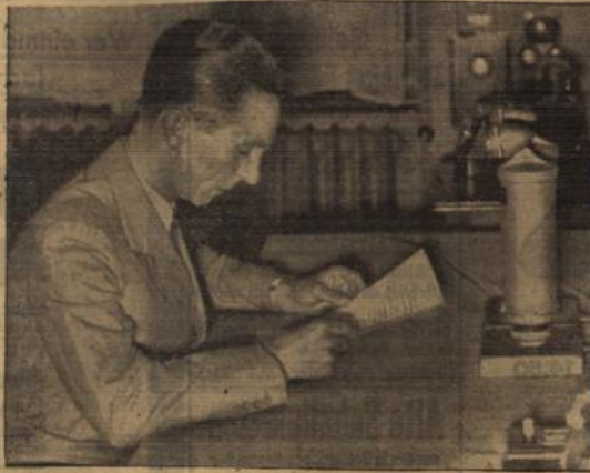
Reichsminister Dr. Goebbels verliest

über alle deutschen Sender das Kommuniqué der Reichsregierung, in dem der Beschluß der deutschen und österreichischen Regierung mitgeteilt wird, ihre Beziehungen wieder normal und freundschaftlich zu gestalten.