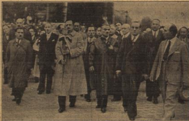
Feier vom Grabmal des Unbekannten Soldaten in Paris für das Frontsoldatentreffen in Verdun. Französische Frontkämpfer entzündeten an der Flagge des Grabmals von Unbekannten Soldaten in Paris eine Fackel, die feierlich zu dem großen internationalen Frontsoldatentreffen nach Verdun gebracht wurde und bei der Feierstunde am Beinhaus auf dem Douaumont zum Zeichen des Friedens erstrahlte.