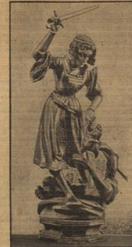
Das Kunstwert des Monats. Das Kunstwert des Monats Juli im Deutschen Museum zu Berlin ist eine Holzstatuette eines Wälderer Reiters um 1500; der heilige Georg, eine modisch eleganter Darstellung des Drachentöters.

Unter dem Leitwort „Verständnis vor Verständigung!“ bringen die Deutsch-Französische Monatshefte (Verlag G. Braun, Karlsruhe) Beiträge aus den verschiedensten Schaffensgebieten beider Länder. Die mutigen Auftritte der Frontkämpfer sind vollständig abgedruckt. Der Ehrenpräsident der Internationalen Handelskammer, H. Froment, gibt in französischer Sprache eine Darstellung der deutschen Wirtschaftspolitik. Sehr eindrucksvoll sind die Berichte über die Lieder der beiden Völker.