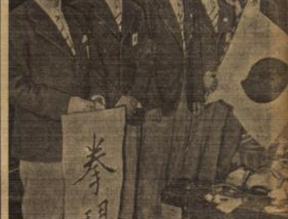
Japans Olympiamannschaft in Berlin. In Berlin trafen, wie wir bereits gemeldet, jetzt 138 japanische Olympiateilnehmer und -teilnehmerinnen, sowie 16 Mitglieder des japanischen Olympischen Komitees ein.

Am Start fehlten Sperling-Dortmund und Edweiler-Büdesheim.