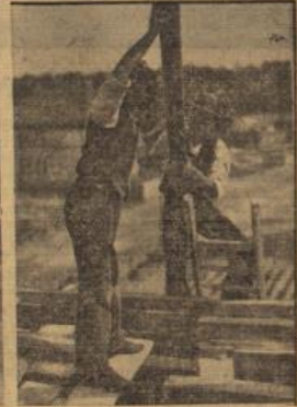
Bild links: Bild in eine Beschlagshämme. Bild rechts: Zimmerleute bei der Arbeit.