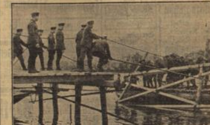
Ein Post wird geleitet.

War schon, wie wir eben gesehen haben, die Aufgabe der Bioniere im Angriffskrieg eine wichtige und umfangreiche, so wird sie das im Verteidigungskrieg noch mehr sein. Geht der Angriffstruppe, wie es in seiner Eigenart liegt, mehr oder weniger schnell vorwärts, so wird eine verteidigende Kampfmehrheit sich möglichst lange an die Stellungen klammern. Hier wird der Bionier so recht der Helfer der anderen Truppen, und jeder alte Frontkämpfer wird sich gern daran erinnern, wie stets die Bioniere bereitwillig beim Bau der Stellungen in vorderster Linie mitgeholfen haben. Doch nicht nur hierbei kommt die Mitwirkung der Bionier-