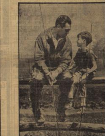
Schmelings jüngerer Freund.

Max Schmeling war noch nie der Meinung, daß die exponierte Stellung eines erklärten Favoriten viel taue. Er sammelte im Laufe der Jahre und Streifen genug Erfahrungen, um den Kummel um eine Weltmeisterschaft aus dem Kopf zu kenne. Ihm ist bekannt, wie eine geschäftstüchtige Klame es liebt, aber auch die feinsten Kleinigkeiten aus den Trainingsquartieren, aus belanglosen Randbemerkungen in den zahlreichen Interviews in den Vordergrund einer angeblich maßgeblichen Beurteilung der beiderseitigen Chancen zu stellen. Er weiß ferner, die geschäftliche Seite der Angelegenheit muß vorher geregelt sein, der Ernst beginnt erst zwischen den Sellen. Es hört ihn darum auch wenig, wenn 3. B. Weltmeister Tunney seinen L. o. in der 3. Runde vorausegagt hat, eine Meinung, die Dempsyer teilt. Als sich der Deutsche durch seine Siege über Basilio, Kuegel und Steve James den Rückweg in den amerikanischen Ring bahnte, hatte er nur den einen Wunsch, noch einmal in eine große Entscheidung zu gelangen. Danach ging sein ganzes Streben, danach lehte er als ein vernünftiger Sportsmann. Gewiß, mit seinen 31 Jahren ist er zweifel-