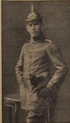
Max Immelman zum Gedächtnis.

Eine wunderbarere Erkennungsmarke hat wohl noch nie einer besseren als dieser unbekannte Flieger. An dem höchsten Orden, am „Pour le mérite“, hat man Immelman erkannt. Tragisch wie dies Jeldem war auch sein Tod. Denn es steht fest, daß er als Unbesiegter auch an diesem Abend beifehrend konnte. Keine feindliche Kugel hat den „Adler von Lille“ zu erlegen vermocht. Hat irgend eine höhere Gewalt in die Wechheit des hochgewinnenden Jägers eingegriffen, verjagte irgend ein Wächchentell dem Willen des