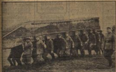
Ein Ponton wird zu Wasser gebracht.

16. Juni 1936: Höchste Temperatur: 21,1. Tagesmittel der Temperatur: 17,9. 17. Juni 1936: Höchste Nachttemperatur: 12,5. Sonnenaufgang am 16. Juni 1936: nachmittags 7 Uhr, 45 Min. nachmittags 6 Uhr, 50 Min.