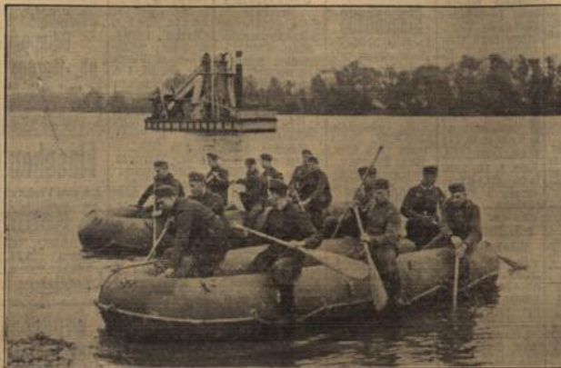
Überübungen mit Floßläden.

Weiterhin muß der Bionier, wie er zerstörte oder beschädigte Brücken oder sonstige Kunstbauten wiederherstellen