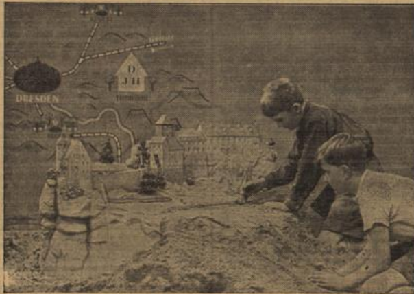
Jungen beim Aufbau des Modells der Jugendherberge Hohnstein in Sachsen.

Nach seiner Entlassung lebte der Unglückliche nur noch wenige Monate bei einem mitleidigen Schneider und starb am 11. Dezember 1756.