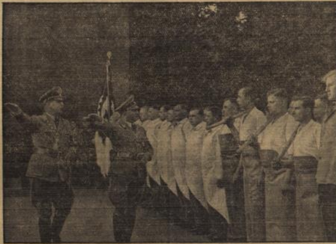
Heldenerhebung des Handwerks.

Der Reichshandwerksmeister schloß seine Rede mit dem Dank an die Reichsregierung, vor allem an den Reichsminister Dr. Goebbels, sowie an Reichsorganisationsleiter Dr. Ley für die wertvolle Förderung des Handwerks in den vergangenen Jahren und daß der überzeugte Ausdruck, daß das deutsche Handwerk sich der Forderung durch den nationalsozialistischen Staat würdig erweisen werde.