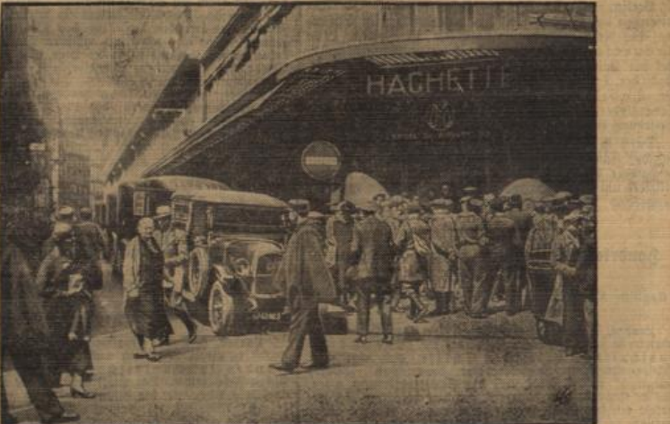
Aus der Pariser Zeitungsvertriebs im Streik.