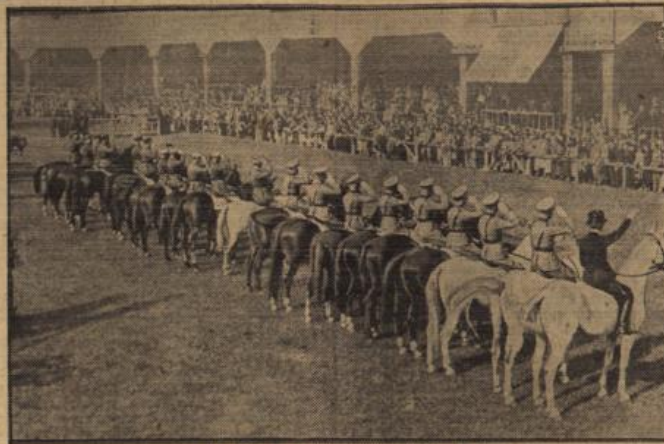
Das Warschauer Reitturnier der sieben Nationen.

Unter Teilnahme von Mannschaften aus sieben Nationen ist in der polnischen Hauptstadt ein internationales Reitturnier im Gange. Auf unserem Bilde begrüßt die riesige Zuschauermenge die Reiter aus Deutschland, Frankreich, Japan, Lettland, Rumänien, Jugoslawien und des Heimatlandes, die vor der Ehrentribüne Aufstellung genommen hatten. Rechts die deutsche Mannschaft, rechts außen Frau von Opel.