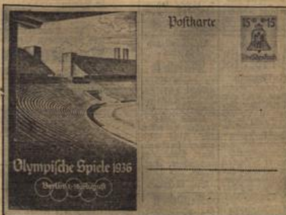
Die Olympia-Postkarten.

Die Tschechoslowakei hat im Frieden 201 829 Mann (einschli. der Gendarmerie) im Heere, das in 12 Infanteriedivisionen, 2 Gebirgsdivisionen sowie 4 Kavalleriebrigaden eingeteilt ist. Mit 1,35% der 15 Millionen umfassenden Gesamtbevölkerung kommt dieser Staat nahe an — wie bereits oben erwähnt — den Hundertsten von Frankreich heran, das 1,4% unter den Fahnen stehen hat! — Die Tschechoslowakei wird im Feldheer 700 000 Mann mobilisieren dazu hat sie weitere 700 000 Ausgebildete zur Verfügung.