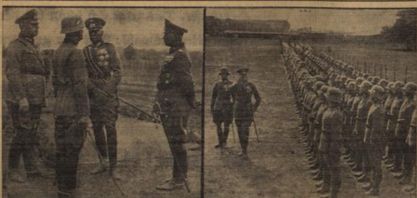
3. Nr. 67 marschiert vor seinem neuen Chef, Generaloberst von Seedt, auf.

Das Angebot von deutschen Eiern blieb auch in dieser Woche ziemlich klein und war angesichts der weiter lebhaften Nachfrage des Verbrauchs nicht voll zufriedenstellend. Die Versorgung erfolgt fast ausschließlich durch deutsche Eier, während Auslandsware nur in geringem Umfange zur Verfügung steht. Die über die Reichsstelle hereingenommenen Eier werden weiter fast reiflos den Küchlhäusern zugeführt. Daneben wird ein großer Teil der anfallenden Mengen deutscher Eier eingeliefert, so daß durch diese Maßnahmen die Vorkantwirtschaft ein sehr günstiges Bild zeigt. Die bereits jetzt vorhandenen Bestände werden weitestgehend beibehalten, in der Zeit der geringeren Eigenproduktion die Versorgung ohne allzu große Inanspruchnahme ausländischer Zufuhren sicherzustellen.