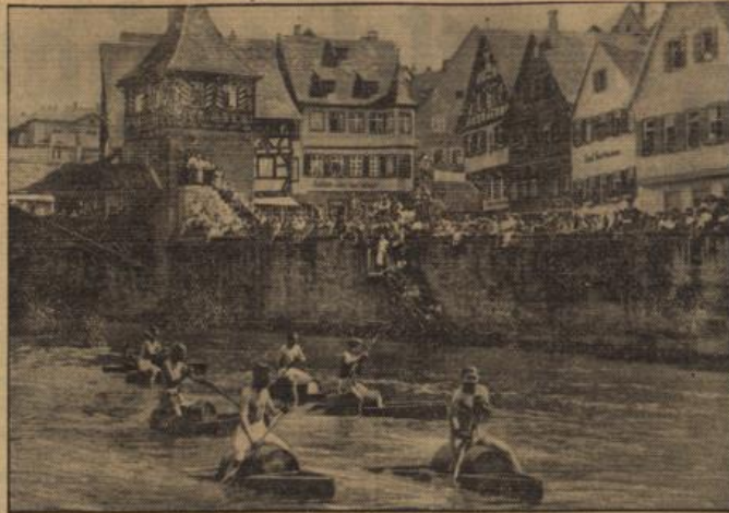
Fahrradrennen auf der Kofter in Hall (Schwaben).

Auf der Weiterfahrt nach der wildromantischen Ruinenstadt Olba 1100 Meter hoch, sahen wir allerhand hochinteressante: Schatule, Adler, Kamelfarawonen, dabei auch ein wüchsiges, fünf Tage altes Kamelfaß. Ferner bemerkten wir Ziegen, aus deren Sattelstücken spähig neugeborene Weibchen lugten. Auch einen drohenden Ziegenfall erleben wir: Ein Bauer kam uns mit Kamel und Esel entgegen. Als das Kamel weiter ansetzte, kriegte es einen solchen Schreck, daß es Bauer und