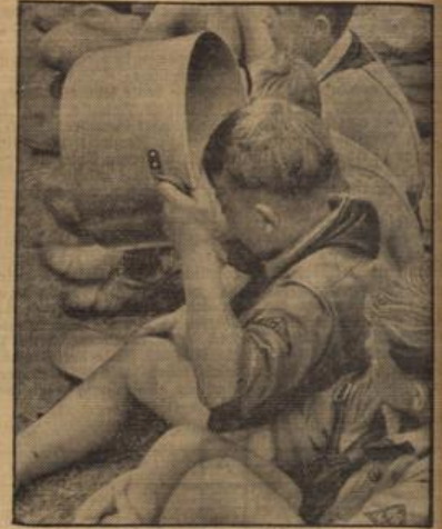
Nach anstrengendem Marsch schmeckt es um so besser.

6. Der dir dies rät, trug mit gutem Erfolg von der Weichsel bis zur Beresina feidene Strümpfe, darüber wollene, und darüber den Stiefel. Rascher, bei Wanderungen, hat sich das bewährt. Es können sich auch die verschiedensten Fußpulver bewähren. Aber das Erste ist: die Übung der Füße auf ihre Elastizität, das Begreifen der Wichtigkeit dieser Glieder, ihre wirkliche Pflege.