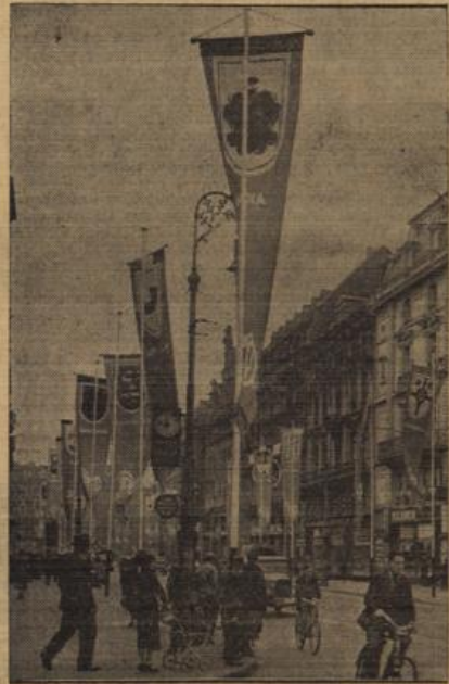
Frankfurt im Zeichen des Reichshandwerkertages. Die Straßen der alten Mainstadt prangen zum Reichshandwerkertag im festlichen Flaggenschmuck.

„Anlässlich des Reichshandwerkertages, an dem teilzunehmen mir aus dienstlichen Gründen leider verweigert ist, wünsche ich Ihnen und dem gesamten deutschen Handwerk namens des deutschen Bauerns ein volles Gelingen dieser bedeutungsvollen Veranstaltung. Möge das wieder erstarrende deutsche Handwerk immer einig gehen mit dem deutschen Bauern, dessen neue Kraft die ideale Zusammengehörigkeit beider Berufsstände festet denn je zusammenführt zum Wohle unseres deutschen Volkes.“