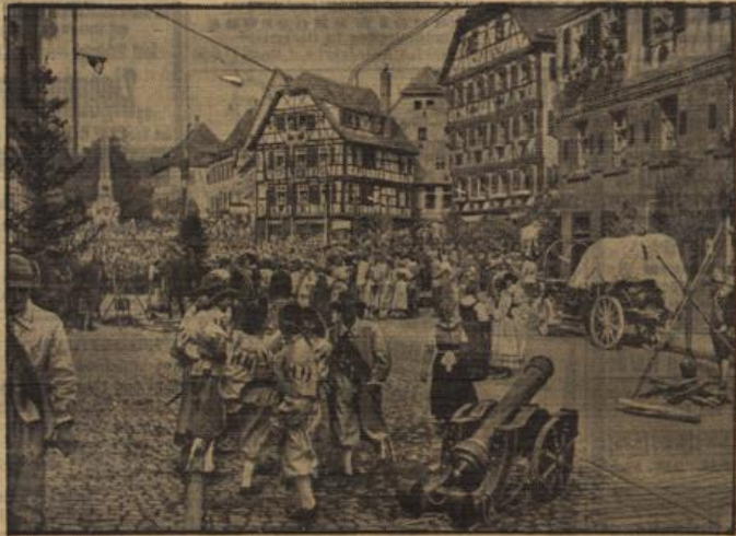
„Wallensteins Lager“ in Mosbach. Mit einer Aufführung von „Wallensteins Lager“ auf dem Marktplatz feierte die Stadt Mosbach am Freitag ihr 1200jähriges Bestehen.

weiter offen. Immer wieder kommen Wanderer, Reigen auf den Turm, kommen herunter, verschwinden wieder. Der Himmel schaut allmählich lauer drein. Es wird immer dunkler. Ein unfreundlicher Wind bläst über uns hinweg. Ein paar Tropfen fallen. Wir machen uns zum Abmarsch fertig. Weit gehen wir nicht. Der M a p p e r Hof stellt sich uns nämlich in den Weg. Auf dem von alten, schon ziemlich baufälligen Gebäuden umgebenen gepflasterten Platz ein Pfau, dessen Rad in allen Farben schillernd vor dem weißen Kalk des Wirtshauses steht. Nachdem wir hier eingeleitet waren, wanderten wir auf S o u s e n u. d. H. zu. Der Himmel sieht immer so aus, als wolle er sagen: Soll ich, soll ich nicht... Und endlich zwischen F i c h b a c h und B ä r e i t a d t, da hat er sich für das „Soll ich...“ entschieden. Es regnete aber nicht lange. Über einen recht abgünstigen Weg gelangten wir ins Reifelbachtal. Schönes weisses Tempelchen im Grünen, Gollplätze, gepflasterte Straßen, ein Lager des Arbeitsdienstes, prominierende Kurgäste, Anlagen, ein Teich, der zum Kahnfahren einlädt, die Brunnensprünge mit Schmelzender Schmelze trinkenden Damen, Automobile, enge Gassen, Sommerhäuser aus dem Dreißigjährigen Kriege; eine lange Straße. Sie führte zum Bahnhof, wo uns schon der Zug erwartete. Still ging hinter den Bergen die Sonne unter.