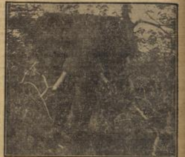
Elefant greift an!

Hans Schomburgk, der berühmte Afrikaforscher, ist uns in Wiesbaden längst kein Unbekannter mehr. Wiederholt hatten wir im Kurhaus Gelegenheit, uns an seinen lebendig gehaltenen, humorgewirzten und von Anfang bis zu Ende fesselnden Vorträgen zu erfreuen. Was ihnen einen besonderen Vorzug verleiht, ist der Umstand, daß der Redner kein „Agroleten“ auftritt, sondern Erlebtes schildert, und daß er trotz dem Reichtum an spannender Abenteuerien stets