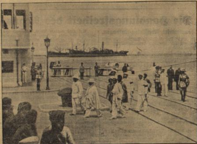
Das erste Bild vom Regus in Haifa. Die Ankunft des Regus (zweiter von vorn) in Haifa, wohin er mit dem englischen Kreuzer „Enterprise“ von Dschibuti gebracht wurde.

Unter diesen Umständen haben sie es für zweckmäßig gefunden, ihre Entscheidung bis zu einer späteren Zusammenkunft zurückzustellen. Sie sind der Meinung, daß es alsbald nach dem Eingang der deutschen Antwort für die Locarno-mächte angezeigt sein wird, unverzüglich zum Zweck des Austausches ihrer Meinungen in Fühlung zu treten.