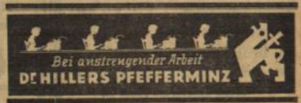
Bei anstrengender Arbeit DEHILLERS PFEFFERMINZ

Am Mittwoch, 29. April, 20.30 Uhr, veranstaltet das Frauenamt der DAF, zusammen mit der Fachgruppe Hausgehilfen im „Haus der Deutschen Arbeitsfront“, Beilrühkrasse 49, einen Kameradschaftsabend. Alle berufstätigen Mädeln und Frauen sind zu diesem Abend herzlich eingeladen. Zeigt, daß ihr mitarbeitet an der großen deutschen Volksgemeinschaft. Schöpft bei diesem fröhlichen Beisammensein die nötige Kraft zur Weltarbeit im Berufsleben. Gäste dürfen mitgeführt werden.