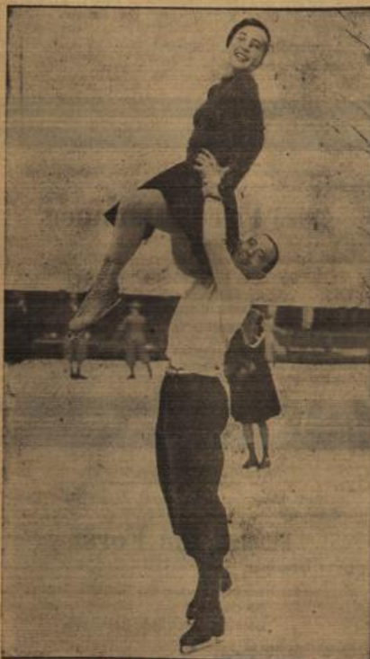
Das siegreiche deutsche Kunstläuferpaar. Magie Herber - Ernst Baier.

Raum war die Mittagspause herum, als die Zuschauer auch schon in Massen zum Olympischen Kunst-Eisstadion