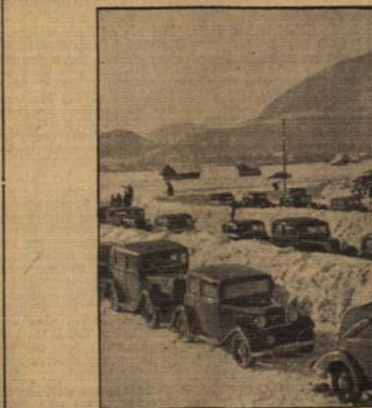
Autos in endloser Reihe.

Das Erscheinen des Führers im Eishockeystadion löste begeisterten Jubel aus, der sein Ende nehmen wollte. Von der kleinen Sprunghalle aus beobachtete der Führer wiederum zum Eishockey, um dem Eiskunsläufer der Paare beizuwohnen. Die Straßen, die der Führer im Kraftwagen