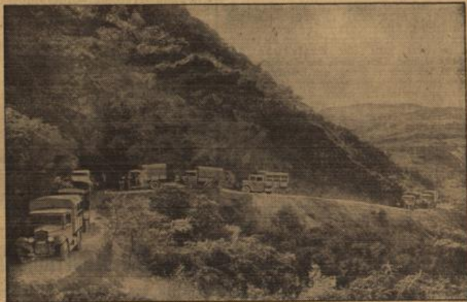
Der italienische Nachschub im abessinischen Hochgebirge. Eine bemerkenswerte Aufnahme von den neuen italienischen Straßen hinter der Kampffront in Nordabessinien. In den Berghängen entlang versuchen die Lastautos die Höhen zu überwinden.