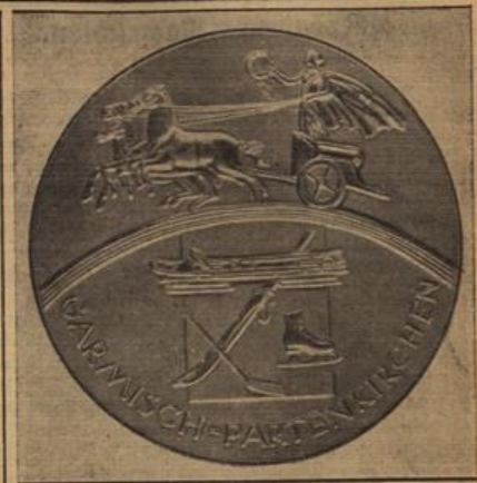
Die Hoffnung aller Olympiakämpfer: Die Olympische Goldmedaille.

Im Gesamtergebnis bedeute die Winterolympiade in hervorragender Weise eine Förderung des Ansehens des Dritten Reiches, und zwar sowohl des Reiches als solches, wie der nationalsozialistischen Bewegung in der ganzen Welt. Wenn die Zubehörfahrt die Olympiade bestohtere, werde sie sich letzten Endes selbst schaden.