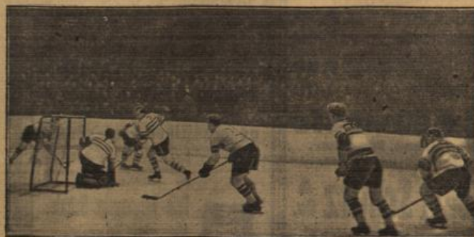
Die deutsch-englische Hockeyschlacht.