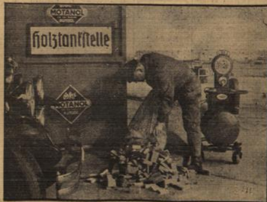
Die erste Holztaustelle auf der Auto-Umgehungsstraße Frankfurt a. M.

Wenn die verschiedenen mit Holzgas betriebenen Wagen öfter mehr oder weniger auch nur zu Versuchszwecken laufen, so stellt doch zweifellos die Einrichtung dieser neuen Holztaustelle auf dem Wege der Entwicklung des Automobilmotors eine bemerkenswerte Etappe dar.