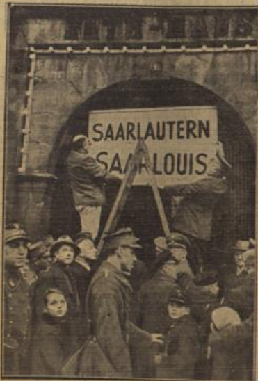
Die Taufe von Saarlautern.

Wohlfreudig wie die Geschichte des Landes an der Saar waren auch die Geschehnisse von Saarlouis. Um die neue Stadt zu bevölkern, wurde auf Befehl Ludwigs XIV. das benachbarte Wallerfangen zerstört, seine Bewohner wurden zwangsweise in Saarlouis angesiedelt. Während des