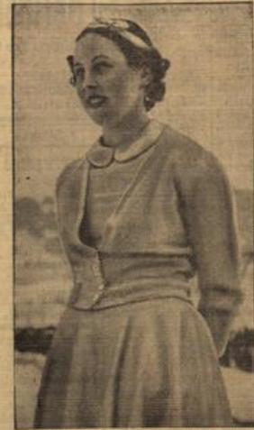
Die beste deutsche Eiskunstläuferin.

Die Europa-Eiskunstlaufmeisterschaften in Berlin vom 24. bis 26. Januar haben als die Generalsprobe der besten Eiskünstlerinnen der Welt für die Olympischen Winterspiele zu gelten. Bekanntlich dürfen an den Europa-Titelkämpfen ausnahmsweise auch Nichteuropäer teilnehmen und von diesem Entgegenkommen wird gerne Gebrauch gemacht. Bisher wurden bereits 30 Meldungen für das Frauen-Kaufen und 16 Meldungen für das Männer-Kaufen abgegeben, außerdem sind acht Paare in die Rennungsliste eingeschrieben.