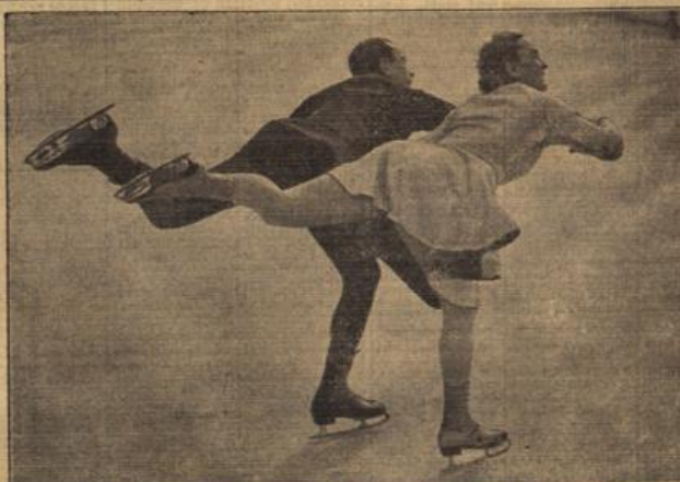
Das Siegerpaar im Paarlaufen bei den Deutschen Eiskunstlaufmeisterschaften in Garmisch-Partenkirchen war, wie erwartet, unsere Hoffnung für das Olympia Marie Herber und Ernst Waier.