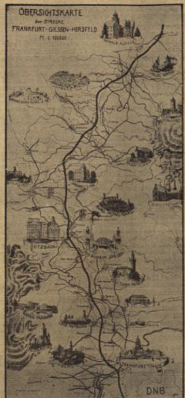
Übersichtskarte der Strecke Frankfurt-Gießen-Hersfeld. (D.N.B.-Geometrie-Institut, Photo: Kern.)

Am 10. Januar 1936 an werden die Fahrpreise für die Reichsautobahn-Autobuslinien Frankfurt-Darmstadt, Frankfurt-Heidelberg und Mannheim und Mannheim-Heidelberg herabgesetzt. In Zukunft können Reisende mit Reichsautobahn-Fahrtafeln zu normalen Fahrpreisen für Verbindungen, in denen Fahrstrecken für Reichsautobahn-Autobusse ausgegeben werden, — auch im Reichsbahndurchgangsverkehr — wahlweise die Reichsbahn oder die Reichsautobahn-Autobusse benutzen. Ein besonderer Zuschlag ist nur zu Fahrtafeln 3. Kl. für Personenzüge zu zahlen. Die Reichsbahnfahrtafeln 3. Kl. für Schnell- und Eilzüge und für die 1. und 2. Kl. der Schnell-, Eil- und Personenzüge gelten ohne weiteres und ohne Fahrgeldausgleich als Fahrtafeln für die Reichsautobahn-Autobusse. Die Reichsbahnfahrtafeln 3. Kl. für Schnell- und Eilzüge sind als Reichsautobahnfahrtafeln 3. Kl. zu verwenden. Reisende mit Verkaufsstellen und Ausländerbescheinigungen 3. Kl. zahlen den gleichen Zuschlag. Reisende mit solchen Fahrtafeln 1. und 2. Kl. werden ohne Zuschlag befördert.