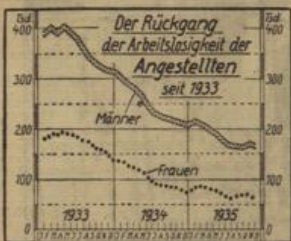
Graphisch-Statistischer Dienst (M.).

In welcher Weise sich die Arbeitslosigkeit der Angestellten seit 1933 verringert hat, zeigt aus Grand eines im letzten Monatsheft des 'Wirtschaftsteils' erschienenen Berichtes das nachstehende Schaubild. Die Arbeitslosigkeit der Angestellten ging von Ende November 1933 bis Ende November 1935 um 237 498 oder 51,1% im Anteil an der Gesamtbeschäftigten von 12,5% auf 11,4% zurück. Die entsprechende Abnahme der Arbeitslosigkeit der Frauen übertrage dabei die den Angestellten ebenso wie übrigens auch bei den Arbeitern die der Männer erheblich, und zwar vermindert sich die Arbeitslosigkeit der männlichen Angestellten um 47,6%, die der weiblichen Angestellten um 59,9%.