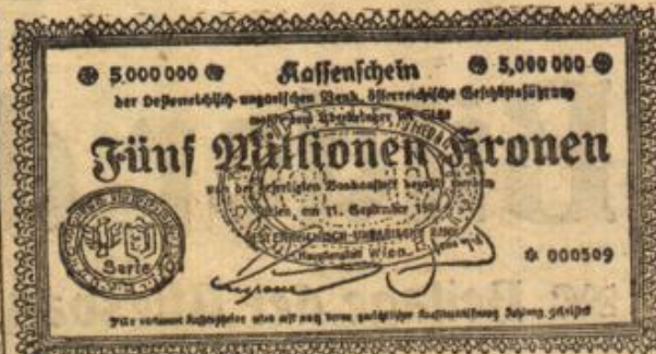
Die neue österreichische Fünf-Millionen-Kronen-Note.

In Amerika, dem Land der unbegrenzten Möglichkeiten, ist ein gigantischer Plan zur öffentlichen Diskussion gestellt: es soll ein technisches Meilenwerk zu schaffen, das selbst den Panamakanal in den Schatten stellen soll. Man beabsichtigt nichts Geringeres, als den St. Lorenz-Strom für tiefgehende, große Seedampfer schiffbar zu machen, einen für Ozeandampfer geeigneten Seeweg aus seinem Gold, der durch die Belle-Isle-Strasse zwischen Labrador und Neufundland und durch die Cabotstraße zwischen Neufundland und Neuschottland mit dem Atlantischen Ozean verbunden ist, bis in das Herz der Vereinigten Staaten, bis an das Gestade der großen Seen, insbesondere des Michigan bei Chisago zu schaffen. In erster Linie wird natürlich Amerika deraufhin den Nutzen des Meilenwerkes haben; aber es wird ausstrahlend auch für die ganze Welt von Vorteil sein.