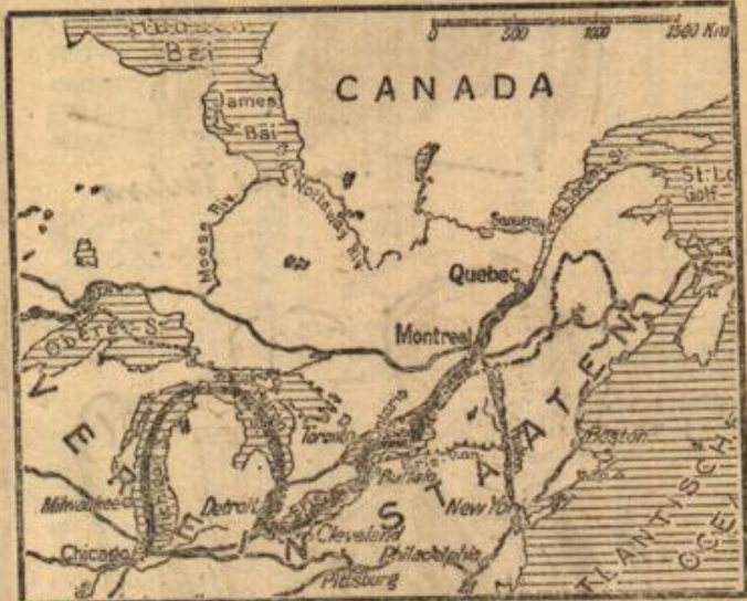
Chisago — Meereshafen.

In der Schweiz macht sich das Bestreben geltend, die osteuropäischen Zustände und Verhältnisse auf allen geschäftlichen und Notabgebieten durch wirkliche Experten sachverständig prüfen zu lassen. Es handelt sich dabei wesentlich um die Absatzmöglichkeiten des schweizerischen Exportes, da der schweizerische Valuta gegenüber den schwachen Valutakändern in arge Bedrängnis geraten ist. Die schweizerische Studentenkommision setzt sich aus Theoretikern und besonders aus Praktikern zusammen, durch deren Zusammenwirken ein erquickliches Ergebnis für die Schweiz sich erhoffen läßt. Die Schweizer haben auf ihrer Durchreise auch Berlin berührt. Die Kommission setzt sich aus folgenden Herren zusammen: Von links de Santard, Bankdirektor, Lausanne. Dr. Jäch, Schweiz. Gewerbeverband. Ch. Burnens, Handels- und Industriekammer Lausanne. Professor Kohn, Rektor der eidgenössischen Techn. Hochschule, Zürich. E. Voos-Decker, Direktor des schweizerischen Nachweisbüros für Bezug und Absatz von Waren, Zürich. Professor Dr. Moos, Schweiz. Bauernverband, Zürich. F. Degen, Sekretär des Schweiz. Gewerkschaftsbundes, Bern. Dr. S. Lüssi, Direktor der Schweiz. Devisenagentur, Bern. Ingenieur Bindel vom Verband ehemaliger Politechniker, Zürich. S. Cassani, Direktor der Schweiz. Volksbank, Bern. E. Sündre, Schweizerische Uhrenindustrie, Genf.