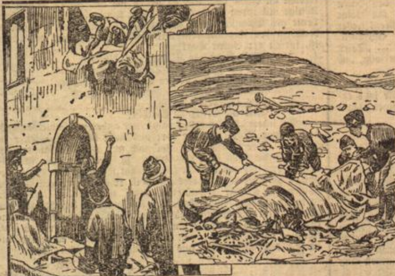
Die Explosionskatastrophe in der Pulverfabrik bei Spezia.

Zaimis hat die ihm angebotene Ministerpräsidentenschaft angenommen. Er entstammt einer der angesehensten Familien Griechenlands, deren Mitglieder sich während der Unabhängigkeitskämpfe seinerzeit große Verdienste erworben haben. Einen großen Teil seiner Studienzeit hat er in Deutschland verbracht; an der Universität Heidelberg erwarb er sich den juristischen Doktorgrad. Seine parlamentarische Laufbahn begann er bereits in jungen Jahren. Er hat dann mehrfach der Regierung angehört und ist auch wiederholt unter schwierigen Verhältnissen Ministerpräsident gewesen.