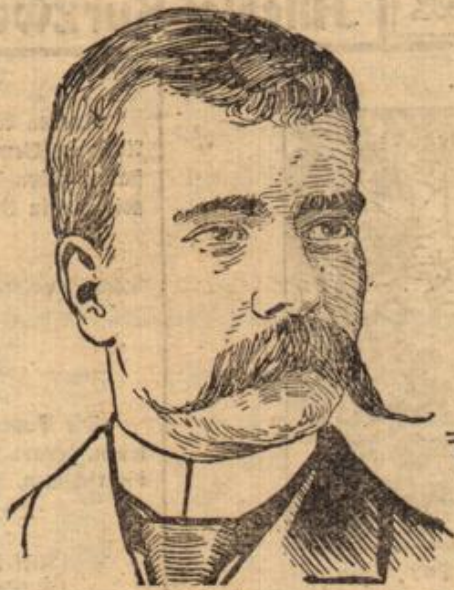
Zaimis, griechischer Ministerpräsident.