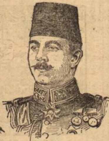
Nureddin Pascha, der türkische Befehlshaber.