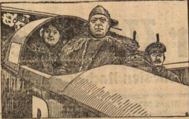
Staatsminister Dr. Köster und Gemahlin besuchen im Flugzeug die Leipziger Messe.

Das Flugzeug erobert sich als modernes Verkehrsmittel immer mehr Terrain. Da wir es als Kriegswerkzeug weder verwenden noch herstellen dürfen, haben wir es vollkommen in den Dienst des Friedens gestellt, und immer weitere Kreise machen von diesem interessanten Beförderungsmittel Gebrauch. Auch viele Damen haben die ursprüngliche Ehen vor dem Flug durch die Luft überwunden, sie setzen sich mit der gleichen Seelenruhe in das Flugzeug wie in das Auto oder in das städtische Eisenbahnabteil. So fuhr kürzlich der Staatsminister Dr. Köster mit seiner Gattin im Flugzeug von Berlin nach Leipzig, um die dortige Messe zu besuchen.