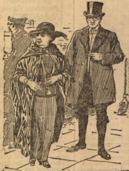
Der amerikanische Botschafter Harven in England. In Amerika ist ein Sturm der Entrüstung aus- gebrochen, daß der amerikanische Botschafter an der Hochzeit der Prinzessin Mary in Knieshofen teil- genommen hat.