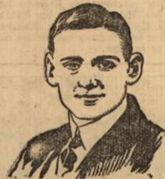
Zur Verlobung im dänischen Königshause. Kronprinz Friedr. von Dänemark.