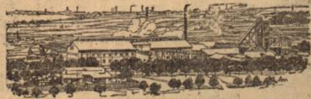
Die Goldminen am Rande von Johannesburg.