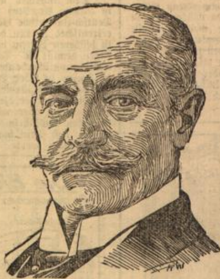
Ministerpräsident von Podewils †.