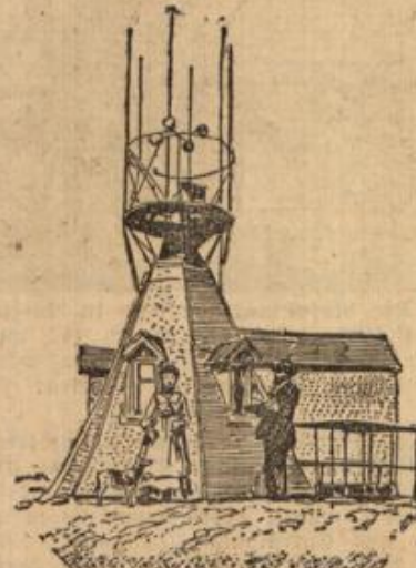
Das Observatorium auf dem Samsø u. der ermordete Wetter- wart und Frau.