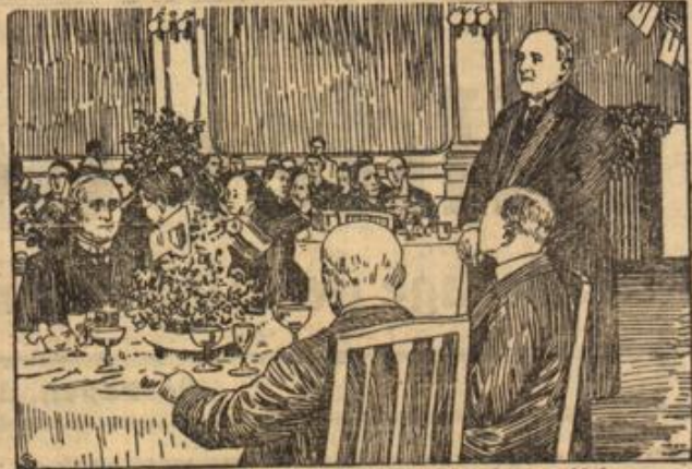
Die Gründungsfeier der Deutsch-Japanischen Gesellschaft in Tokio.