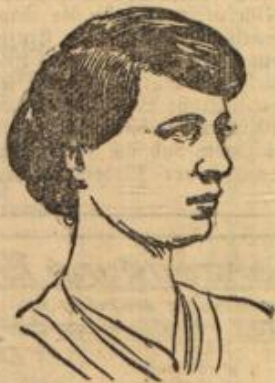
Zur Verlobung im dänischen Königshause. Prinzessin Olga von Griechenland