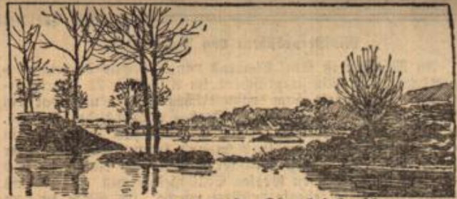
Die Sammelbrüche der Oder bei Treben.

Der Versailler Vertrag, der uns außer vielen anderen Wertobjekten auch unsere Flotten nahm, hat es zu Wege gebracht, daß ein ganz neuer Dampferthp entstanden ist. Auf der Germania-Werft in Kiel ist ein eigenartiger Neubau mit dem Motor-Lautschiff „Ditpreußen“ von 3000 Tonnen Ladefähigkeit zu Wasser gebracht worden. Der Rumpf dieses für den Deltransport bestimmten Schiffes besteht in der Hauptsache aus zwei Druckkörpern von U-Boot-Kreuzern, die auf Grund des Friedensvertrages ihrem ursprünglichen Zweck nicht mehr zugeführt werden konnten. Der Schiffsrumpf ist dadurch geschaffen worden, daß zwei solcher Körper von 5,75 Meter größtem Durchmesser und 77 Meter Länge parallel miteinander verbunden, mit einem Aufbau versehen und kurze Vor- und Dinterschiffsteile angebaut wurden, um eine alte Schiffsförmigkeit zu erzielen.