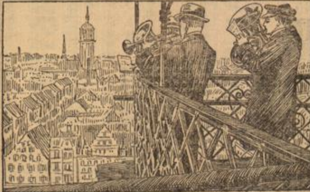
Die Reformationsfeier in Wittenberg.