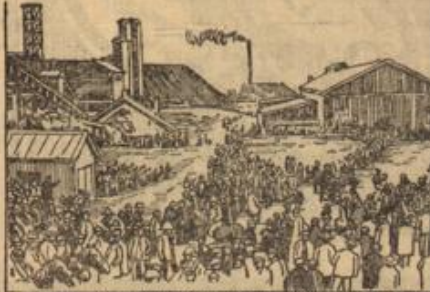
Links: Ansammlungen von Demonstranten.