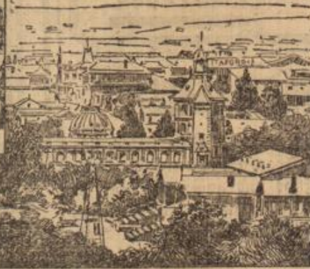
Teilsicht von Johannesburg.