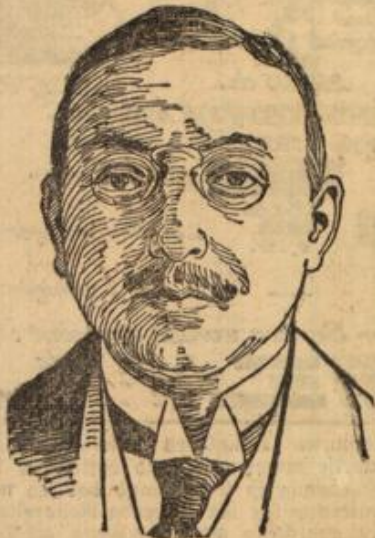
Dr. Hermes wurde zum Reichsfinanz- minister ernannt.