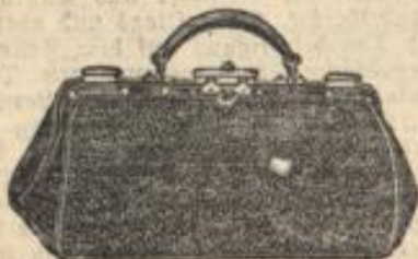
Handtaschen von 25 S. an in jeder Preislage.

Spezialgeschäft für Wein u. Edelbranntwein Telephon 868 Bleichstr. 17. Gegründet 1878.