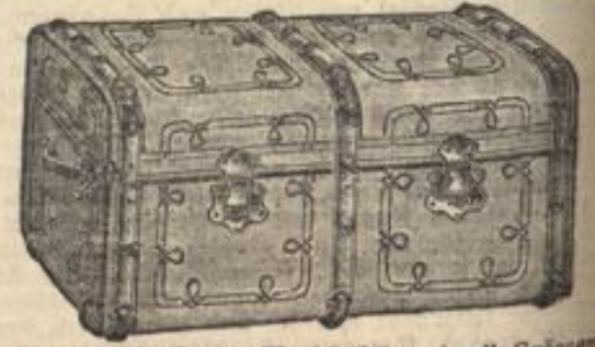
Reise-Koffer v. M. 16.25 an in all. Größen.