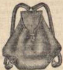
Rucksäcke von 45 S. an. Erprobte Qualitäten.