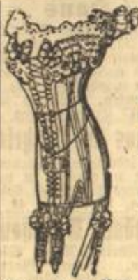
Schaur in der Mitte Planchette etwas seil.

f. Fischen, Braten, Baden u. Einmachen. 50 Pf. bei Frau Rulert, Westendstraße 21. I.