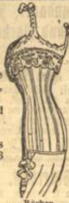
Rücken ohne Schürmung

Webergasse 18. Anproben ohne Kaufzwang. — Teleph. 605.