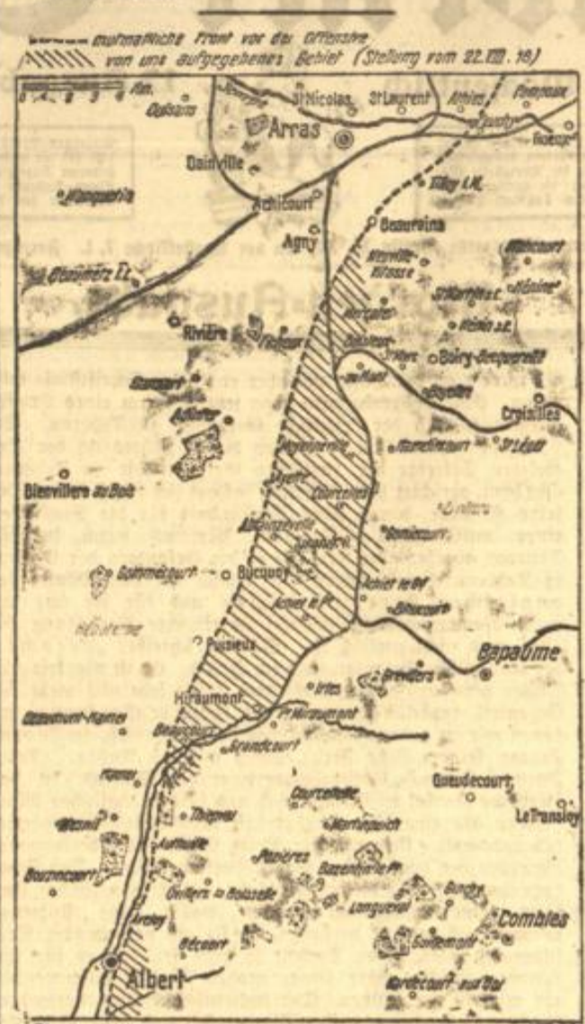
Die englische Offensive zwischen Arras und Albert.

den mußte. Das Ergebnis wird eine weitere Last für die Engländer und Franzosen sein, und die Aufgabe, die Deutschen zu schlagen, wird dadurch noch etwas härter, aber höhere Erwägungen haben den Ausschlag, und der Preis wurde bezahlt, um Deutschlands Gefangene vor weiteren Mißhandlungen zu schützen.