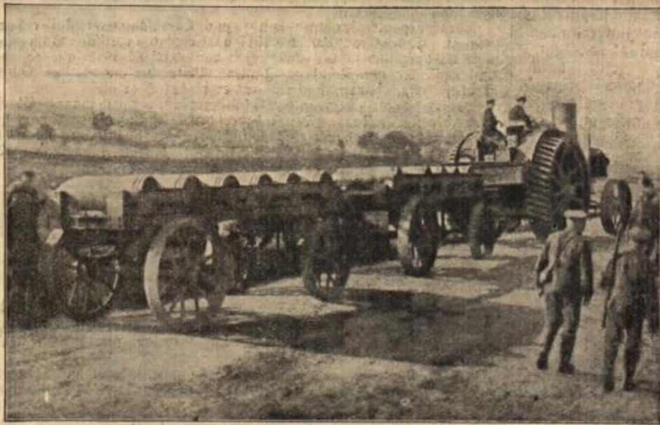
Von der Westfront: Großkalibridge englische Geschosse werden mittels Straßenlokomobile befördert.

von der Verwundung, nur mit dem Reiten ging es noch nicht recht. Seit acht Tagen lag sein Regiment, das große Verluste gehabt, hier auf deutschem Boden, nicht fern der französischen Grenze, in Ruhe. Das alles erzählte er mit einer ihm sonst ganz und gar nicht eigenen Beredsamkeit. — Ehe denn der Wagen kam, wußte er auch über Ingeborgs Reisezweck Bescheid.