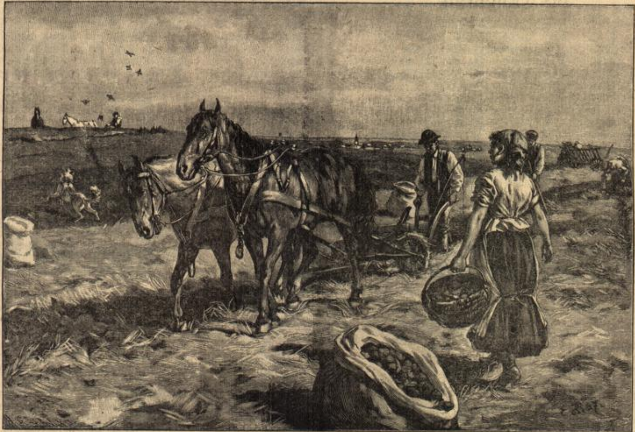
Kartoffellegen.

„Oh, zu lebenswürdig, Herr Leutnant!“ rief sie aus, während