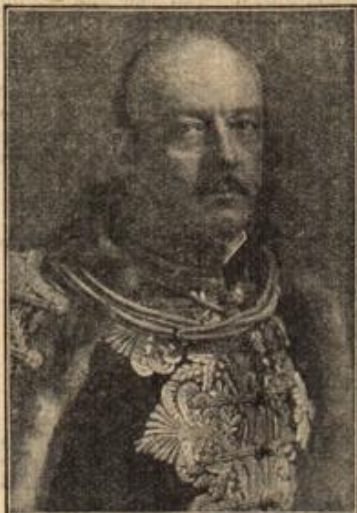
Graf Leopold Berchtold, wurde zum Oberstkämmerer Kaiser Karls ernannt. (Mit Text.)