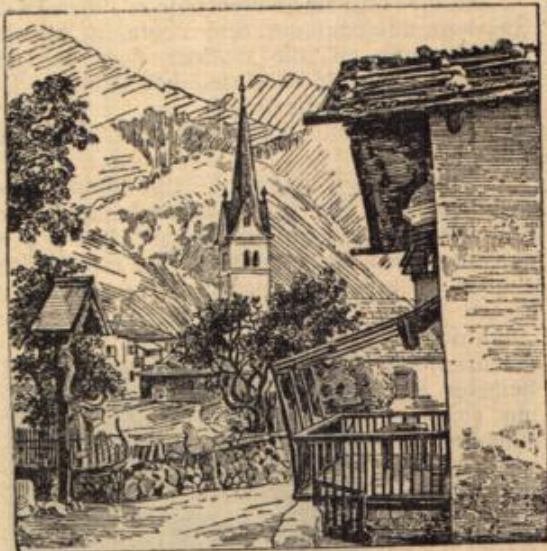
Wo ist die Wirtin?

Schloß und ich hüte die Nähe vom Gut, weil ich zu weiter nichts nütze bin."