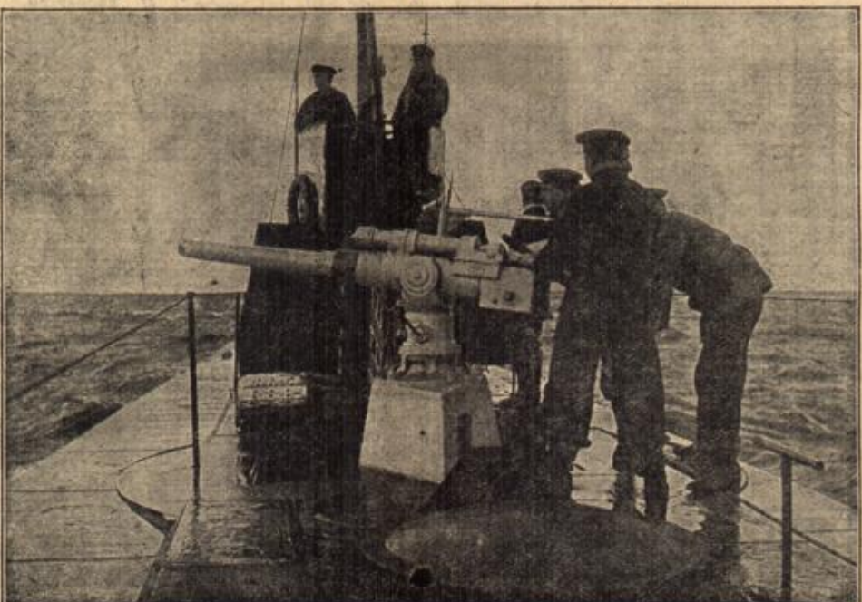
Am Schnellfeuergeschütz eines deutschen U-Boots. Die neuen Unterseeartillerien sind mit zwei solcher weittragenden Geschütze ausgerüstet.

Das Schloß mit seinen düstern, grauen Mauern, den vielen kleinen Fenstern und den spitzen Türmchen besaß rein gar nichts Anheimelndes. Aber schön war die neue, mit weißen Marmorplatten belegte Terrasse, zu deren beiden Seiten immergrüne Bäume standen. Und dann die wohlgepflegten Beete mit den bunten Frühlingsblumen davor! — Hüftelnd schritt das eisgraue Männlein mit seiner Last von sechsundachtzig Jahren vor Ingeborg