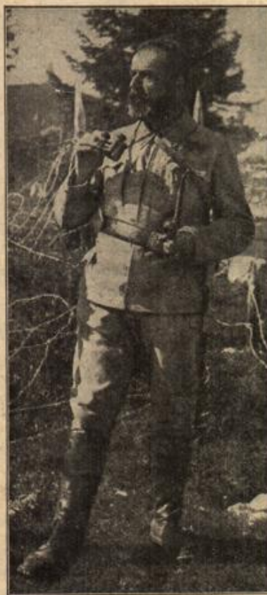
Ein Nachkomme Andreas Hofers. (Mit Text.)

gegen drei Viertel eins schreitet die junge Lehrerin wieder an der Haltestelle wartend auf und ab. Der Händler ist nirgends zu sehen. Dafür geht nun schon zum zweitenmal ein elegant