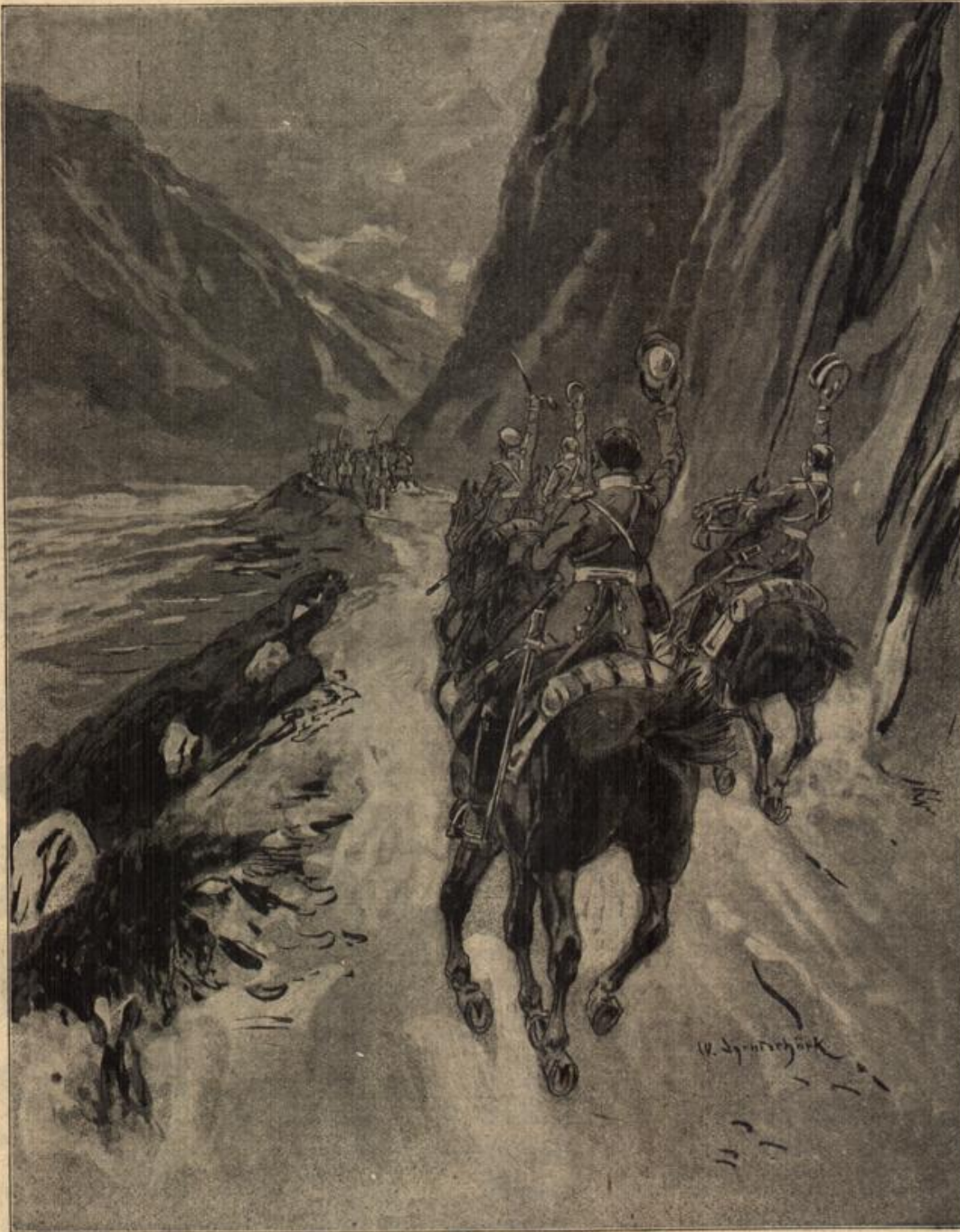
Das erste Zusammentreffen mit den Bulgaren. Gezeichnet von Walter Strylschöck. (Mit Text.)

Die schlichten, innigen Weisen, die zur Weihnachtszeit in aller Munde sind und Herz und Gemüt immer von neuem erquickend und gefangen nehmen, sind so allgemeines Volksgut geworden, daß es selten jemand einfällt, nach ihrem Ursprung zu fragen, und wenn er darnach fragt, so wird er nicht so leicht einen richtigen Bescheid erhalten. Deshalb hier einige Worte über die Herkunft der bekanntesten und beliebtesten Weihnachtslieder. Die ältesten, bei uns noch gesungenen Lieder stammen aus dem sechzehnten Jahrhundert, so das: