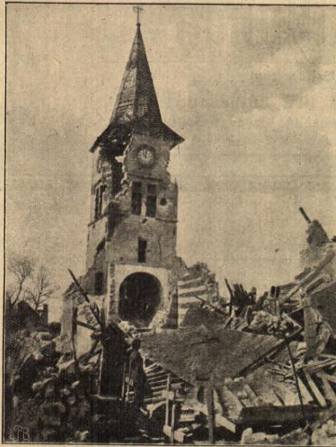
Die von den Franzosen und Engländern zerstörte Kirche von Tholus bei Arras.

Frau Lotti schwirrte der Kopf. Sie wußte nicht mehr, sollte sie lachen oder weinen. Daß ihre harmlose Erfindung so weitgehende Konsequenzen haben würde, das hätte sie sich allerdings nicht träumen lassen. Es ist schon nicht leicht, als tatsächlicher, glücklicher Besitzer von Geld wohlgemeinte Ratschläge über sich ergehen zu lassen, aber mitanhören zu müssen, was man mit Geld machen sollte, was man gar nicht zur Verfügung hat, das ging wirklich fast über Menschenkräfte. Sehnsüchtig erwartete das arme Frauchen die Heimkehr ihres Gatten, damit endlich einmal das Gespräch in andere Bahnen gelenkt würde. Ein trostloser Jammer überkam sie plötzlich. Daß sie verurteilt war, eine so jämmerliche Komödie vor den Allernächsten zu spielen! Ein paar scheue Tränchen wollten gerade aus den Augen über die Wangen herabrinnen und wurden hastig mit der kleinen, festen Arbeitshand abgewischt, als das bekannte Klingelzeichen Frau Lotti die Heimkehr ihres Mannes anzeigte. Rasch drückte sie sich noch einmal die Handflächen gegen die Augen, um ja keine Spuren des verräterischen Nasses sehen zu lassen, dann bemühte sie sich, auf das traurige Gesicht ein heiteres Lächeln zu zaubern, und ging öffnen. Erstaunt prallte sie aber