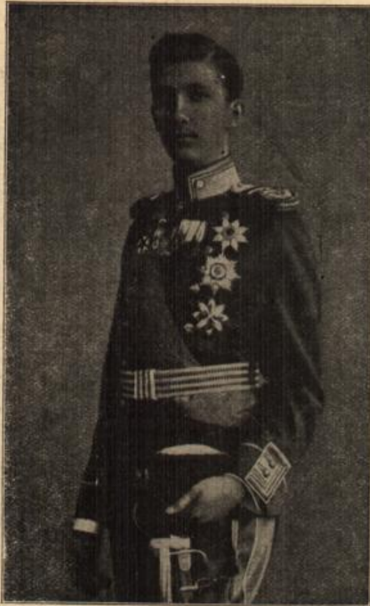
Boris, Kronprinz von Bulgarien.