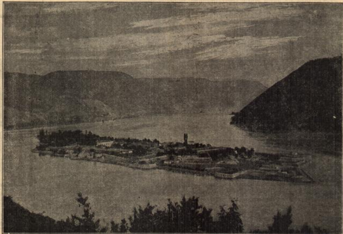
Der Schauplatz des Donauübergangs bei Drjova. (Mit Text.)