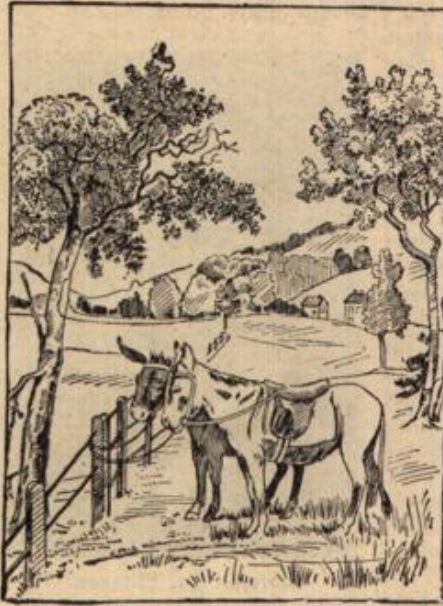
Wo ist denn der Fuhrmann?

„Ei freilich, Euer Gnaden“, antwortete der Wirt sehr wichtig. „Wir haben zurzeit eine sehr gute Operngesellschaft hier, die jeden Abend ‚Ernani‘ zu lebhafter Freude unserer Bürgerschaft aufführt. Euer Gnaden werden wissen, ‚Ernani‘ ist die neueste Oper unseres berühmten Komponisten Verdi. Die Vorstellung soll ausgezeichnet sein.“