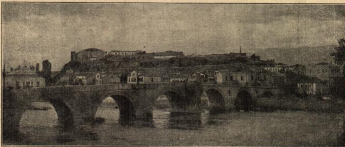
Die serbische Stadt Kiskub, die alte Hauptstadt Mazedoniens. (Mit Text.)

herein. Ein allgemeines heiteres Hallo begrüßte ihn. Da bisher nur Frauen anwesend waren, die bekanntlich alle ein Teilchen Neugierde von ihrer Stammesmutter ererbt haben, kann man sich denken, daß die Begrüßung so recht oberflächlich vor sich ging, weil alle darauf