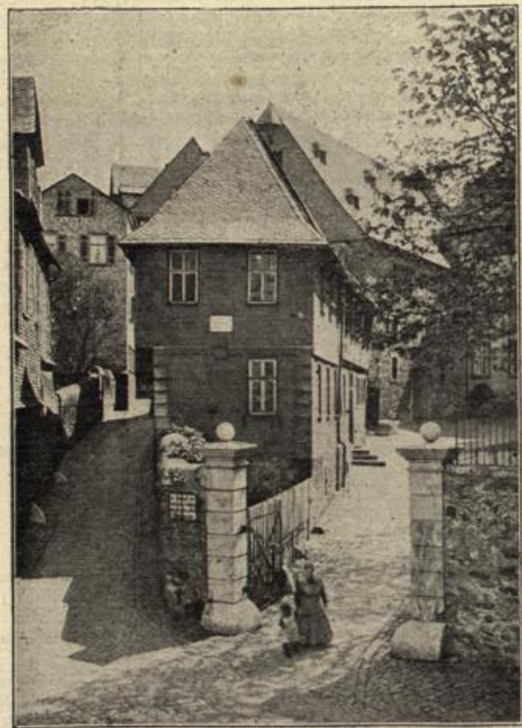
Das Lotte-Haus in Weplar. (Mit Text.)