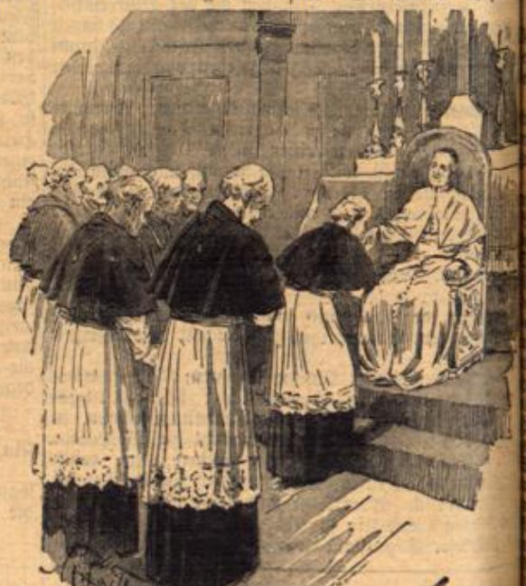
Die Adoration des neuen Papstes durch die Kardinäle.

Wo das Konklave errichtet werden soll, hängt vom Beschluß des Kollegiums ab, gewöhnlich ist es im Vatikan. Im Konklave angekommen, begeben sich die Kardinäle in die Kapelle, in welcher das Skrutinium, d. h. die Geheimwahl später vorgenommen wird. Nach verrichtetem