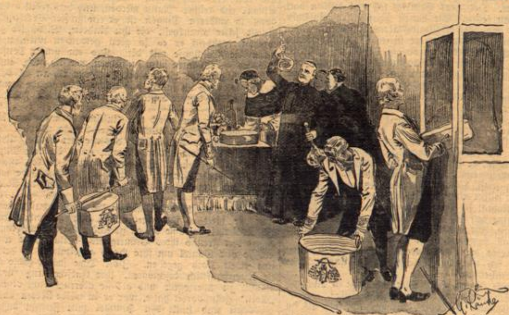
Untersuchung der Speisen, welche ins Konklave gebracht werden.

Sie unterscheiden sich auch durch die Farbe der Tapeten, insofern, als die Zimmer derjenigen Kardinäle, von dem verstorbenen Papste erwählt wurden, mit grünem Zeug, die Zellen der übrigen Kardinäle mit gelbem oder rotem Stoff bedeckt sind. Der Raum dieser