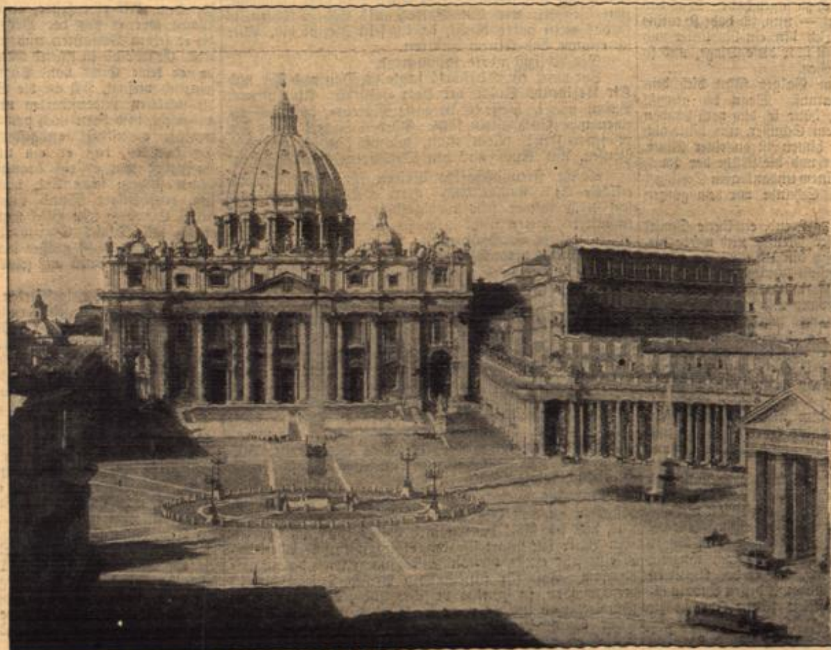
Die Peterskirche in Rom.

Der Gott, der Eisen wachsen ließ, Der wollte keine Knechte.