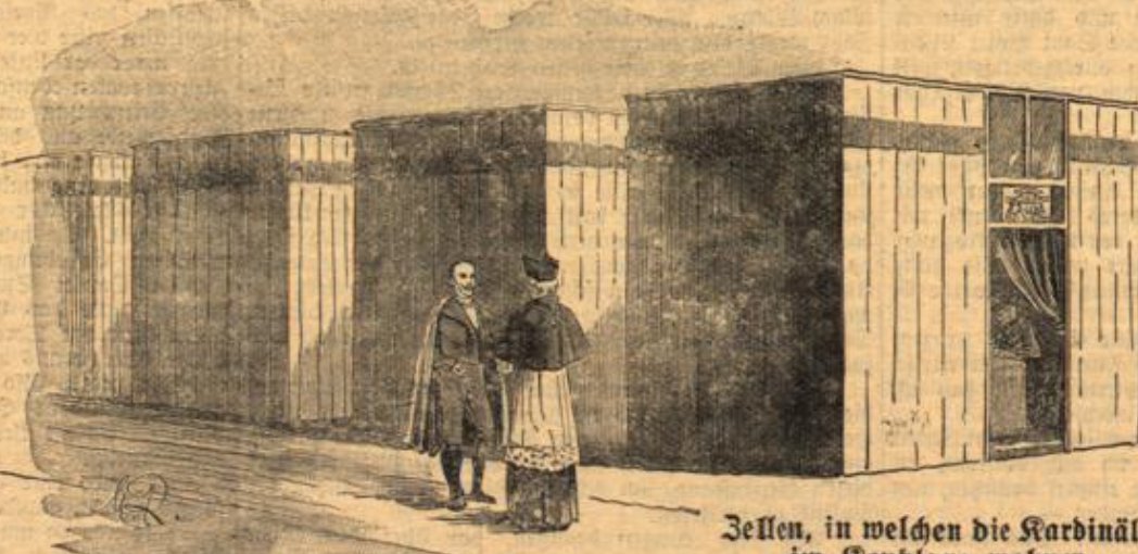
Zellen, in welchen die Kardinäle im Konklave wohnen.

Die ersten grundlegenden und noch heute mit unwesentlichen Abänderungen zur Ausführung gelangenden Bestimmungen über die Neuwahl eines Papstes traf Papst Gregor X. auf dem Konzil zu Lyon im Jahre 1274 durch die Einrichtung des Konklaves, nachdem einer seiner Vorgänger, der Papst Alexander III., auf dem dritten Laterankonzil im Jahre 1179 die Wahl ausschließlich den Kardinälen übertragen hatte. Wir werden im Nachstehenden die wichtigsten und interessantesten Momente einer Papstwahl an der Hand des bestehenden Rituals in Bild und Wort zur Darstellung bringen.