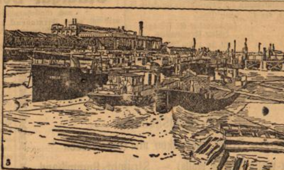
In unserem Vordringen gegen den Sereth.