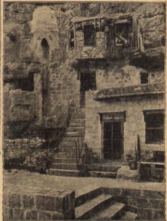
In die Felsenwände von Mar Saba eingebaute Mönchwohnungen. (Mit Text.)

ein, wie er vorhin, während der Unterhaltung, fast unausgeseht die Dose angestarrt hatte — also war's doch so! Sein Schwiegersohn ein Aseptomane — entsetzlich war das ja! Was nun? Wie sollte er seiner Frau und seiner armen bedauernswerten Tochter dies furchtbare Geheimnis enthüllen? Das konnte er nicht, nein, das konnte er nicht! Und diesen Mann hatte er eben noch als