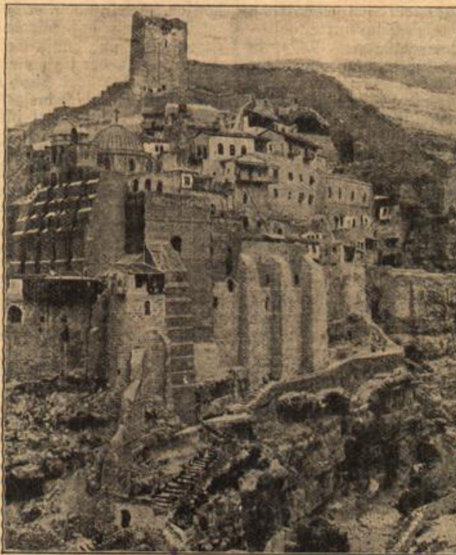
Gesamtansicht der Mönchsansiedlung Mar Saba. (Mit Text.)

„Das ist immerhin möglich, denn ein schnupfender Liebhaber hat unbedingt etwas Komisches!“