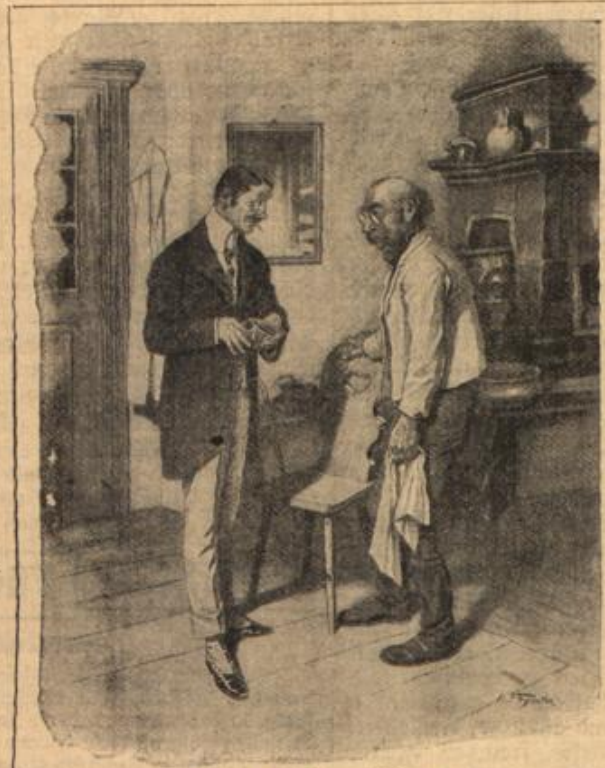
Übung macht den Meister. „Bin ganz erhaunt, Meister, daß Sie meine Haare so tadellos schneiden konnten; ich dachte, Sie hätten doch gar keine Übung darin?“ „Ja freilich, kumt mir mehr, wo I doch alleweil an Wirt keine dreihundert Schafe scher'n muah!“

Männern wurde auch Abanzis Studierzimmer gereinigt und geordnet. Als er es betrat, fragte er die Magd: „Was hast du mit den Papierstücken gemacht, die am Barometer lagen?“ — „Nun, die waren so schmutzig,“ antwortete die Gefragte, „daß ich sie verbrannt habe.“ — Abanzis kreuzte die Arme, kämpfte einige Augenblicke mit sich selbst und sagte dann ruhig und gefaßt: „Du hast die Ergebnisse einer siebenundzwanzigjährigen Arbeit zerstört. Für die Zukunft jedoch berühre nichts in diesem Zimmer!“ R.