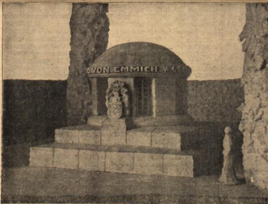
Entwurf zu einem Ehrengrabmal für General v. Emmich in Hannover. (Mit Text.)

Von alledem hörte Friß aber herzlich wenig, denn alle seine Gedanken waren immer nur bei der Tabaksdose, die er heimlich immerfort anstarrte.