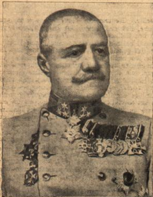
Adolf Freiherr von Rhemen zu Barenfeld, General der Infanterie, wurde zum Generalgouverneur für das okkupierte Serbien ernannt.