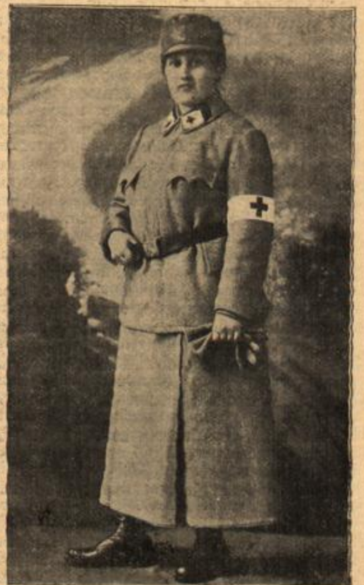
Eine ungarische Ärztin an der Front.

Der Alte nickte und legte die Dose neben sich auf den Tisch und begann wieder ein Gespräch über Ehe- glück und Ehepflicht.