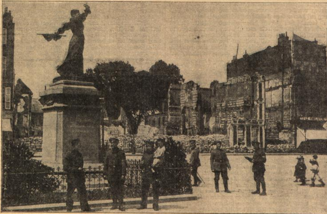
Marktplatz von Peronne mit zerstörten Häusern und dem Denkmal der heldenmütigen Jungfrau von Peronne.

„Als ich der Welt noch angehörte, nannte man mich Bertold von Madenzell!“ entgegnete der Bruder mit sanftem Lächeln, indem er auf das auf seiner Brust hängende Kreuz deutete. „Als Bruder Volker steh' ich heut' vor dir. Als wir in unseren goldenen Jugendtagen an wilden Kriegsspielen uns ergötzten, da hättest du wohl nicht geahnt, daß du mich einst als Priester wieder findest? Ist auch mein Wille nicht gewesen — gedachte wie du ein frischer Reitermann zu werden, im vollen Leben meine Kräfte zu erproben, aber der Mensch denkt, und Gott lenkt! Er hat mich auf den rechten Weg gewiesen, nachdem all mein Hoffen auf irdisches Glück täglich Schiffsbruch erlitten, und heute dank' ich es dem Ewigen, daß alles so gekommen ist. Doch davon später! In trauriger Stunde will ich dir mein Schicksal künden; jetzt liegt die Pflicht mir ob, die ehrsame Jungfer zur edlen Frau von