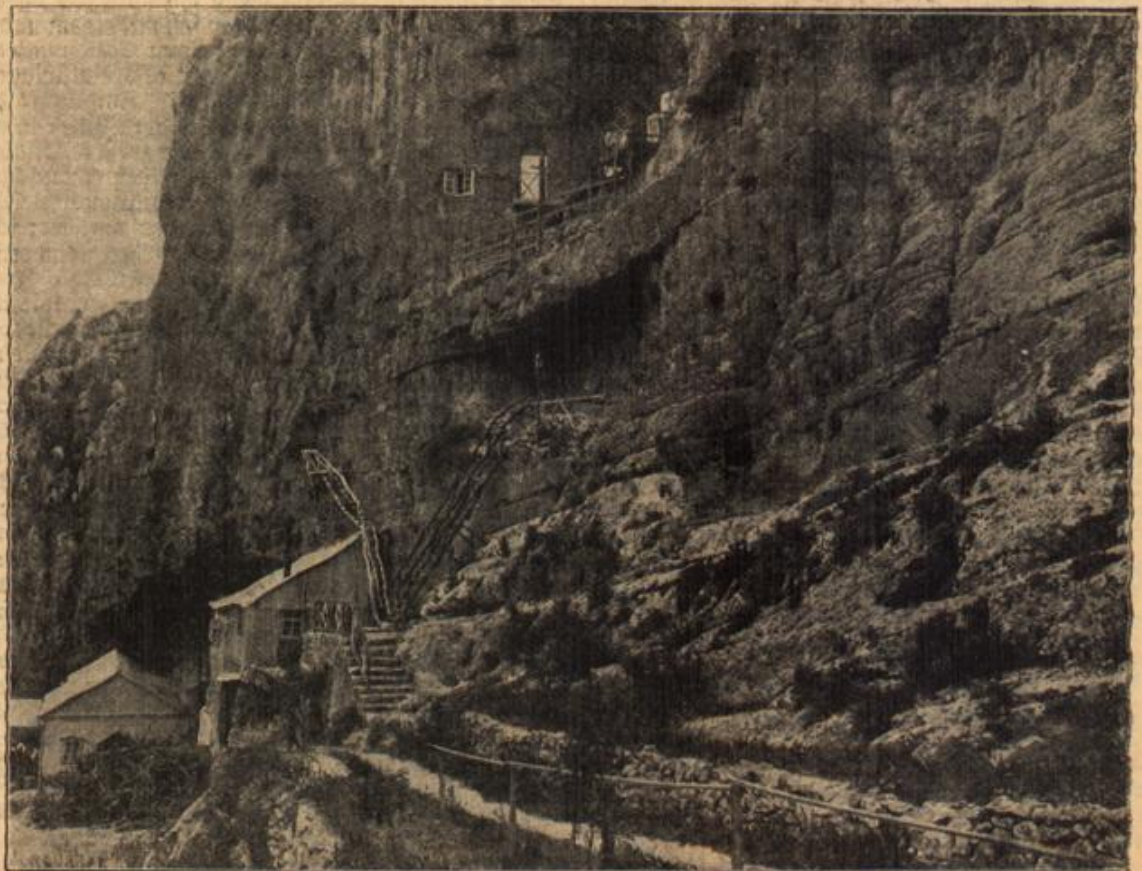
Durch Treppen und Galerien zugänglich gemachte Felsenwohnungen bei Ein Fava in Palästina. (Mit Text.)