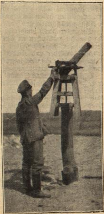
Balton-Abwehrkanone, gegen russische Artillerie gerichtet, zum Abfeuern bereit

„Sie haben ihn zehnfach erlitten“, sagte der Geistliche milde. Noch einmal stieg das Leben lodend auf vor dem geistigen Auge des Schwerverwundeten. Nie vergessene Bilder von unvergleichlicher Schönheit zogen in rascher Folge an seiner Seele vorüber. Doch wie eine Versuchung wies er sie weit von sich.