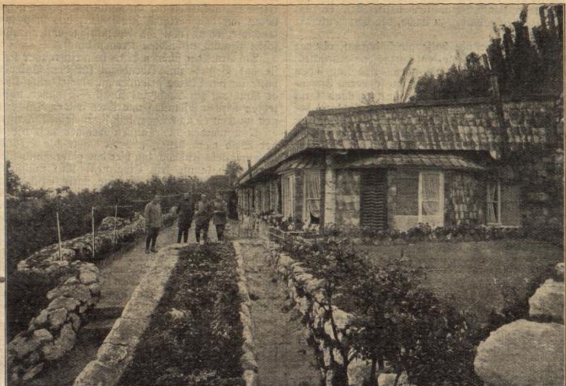
Unterstand eines Regimentskommandeurs, errichtet von deutschen Soldaten in Nordfrankreich. (Mit Text.)