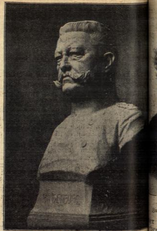
Generalfeldmarschall v. Hindenburg. Zum Jahrestag der Schlacht von Tannenberg am 28. August 1913. (Mit Text.)

Der Heldentod des Sohnes würde ihm erst wieder seine Ehre zurückgeben. O, wie gerne wollte er sterben, ein Dasein enden, das ihm, so kurz es war, schon so oft zur Last geworden war! Aber ein Zufall wollte, daß sein Bataillon immer zurückbehalten wurde. Seine Ungeduld hatte ihn fast schon veranlaßt, sich zu einer besonders gefährdeten Waffe zu melden. — Aber nun hatte er den Dual des Wartens ein Ende! Gott würde barmherzig ihn zu sich nehmen, was sollte er noch auf der Erde? Gedanken fingen an, sich im Halbschlaf zu verwirren, das Zeichen zum Aufstehen. Wie im Fluge verging die Zeit zum Aufbruch. In Eilmärschen ging es in die Feuertaufe