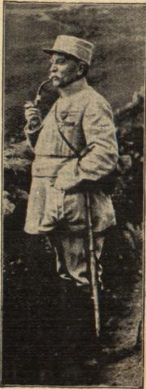
General de Mand'hai, Befehlshaber des französischen Heeres in den Bogaien.

Er schloß die Augen und ließ die Bilder der Vergangenheit an seinem Geiste vorüberziehen. Er war das gehütete und gepflegte Kind angesehener Eltern, die den einzigen Sohn nur zu sehr verwöhnt hatten. Kein Wunsch wurde ihm verweigert. Als er dann auf sich selbst gestellt, sich der Versuchung gegenüber sah, verstrickte ihn Leichtsinns und Genußsucht in schwere Schuld. In der Trunkenheit entspann sich ein Streit zwischen ihm und seinen Kameraden, in dessen Verlauf er einen, der ihm nahegestanden