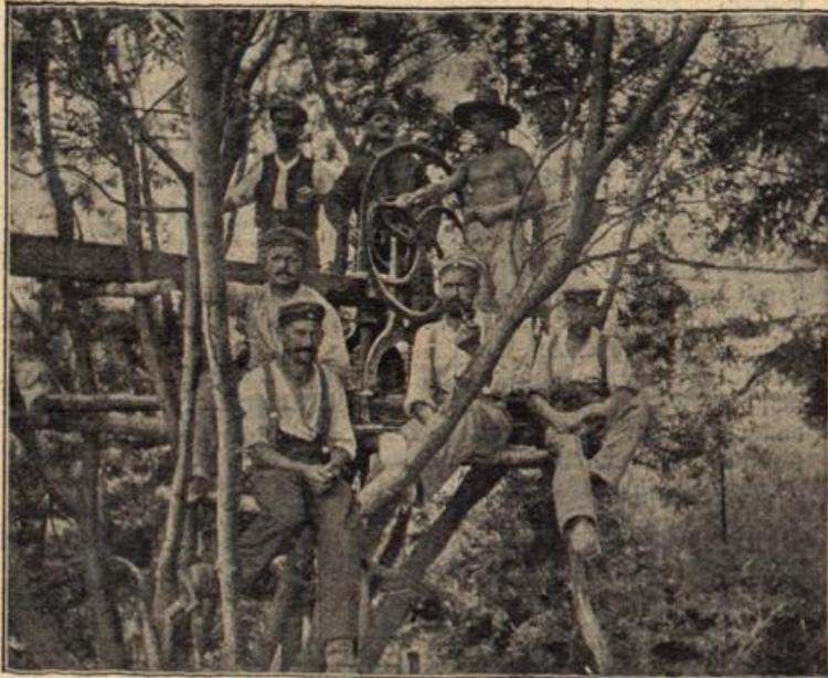
Pumpvorrichtung zum Entwässern und Trockenhalten von Schützengräben.

hatte, erstach. Er wurde vor Gericht gestellt und mußte im Gefängnisse büßen. Die Mutter war grau geworden, als er sie wieder sah. Von allem Verkehr hatten die Eltern sich zurückgezogen, um — erwählte es genau — sich nicht von ihm zurückziehen zu müssen. Und wie gesellig hatte die Mutter früher gelebt! Es schnitt dem Sohne ins Herz, ihr zunehmendes Stumpfwerden zu beobachten. Alles setzte er daran, um sich wieder in die Höhe zu arbeiten. Aber mit tiefer Bitterkeit mußte er erkennen, wie namenlos schwer es dem einmal Gestrauchelten gemacht wird, das Vertrauen seiner Mitmenschen, das er sich vielleicht nur mutwillig verschert hat, zurückzugewinnen. Immer, wenn er dachte, er sei auf dem Wege, sich eine geachtete Existenz zu schaffen, kam unversehens die Erinnerung an die böse Vergangenheit und machte alles wieder zunichte. Ob er nun einen traf, der ihn aus der Strafanstalt kannte, oder ob jemand seinem Brotherrn Mitteilung von seiner Verfehlung machte — die Wirkung war ja immer die gleiche — er mußte sein Bündel schnüren und weiterziehen. Den Neid und die Mißgunst der Menschen — Paul Gebhard hatte sie bis zur Reife austosten müssen! Er war der Verzweiflung nahe, als der Krieg ausbrach. Fast hatte er schon selbst Hand an sich legen wollen. Nun schien es ihm, als sei es ein Wink des Himmels, ja, es hätte nicht viel gefehlt, dann hätte er den Krieg