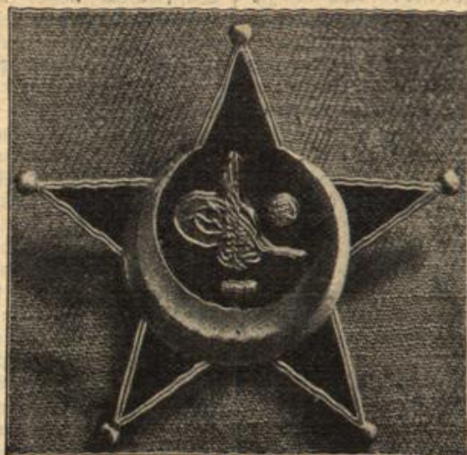
Der eiserne Halbmond. (Mit Text.)

Der eiserne Halbmond. Im türkischen Heere ist jetzt, nach deutschem Vorbilde, eine Kriegsauszeichnung geschaffen worden, die dem deutschen Eisernen Kreuze gleichkommt.