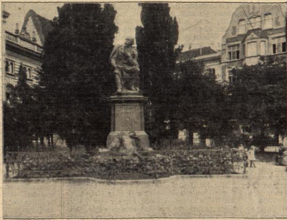
Das Geibel-Denkmal in Lübeck. (Mit Text.)