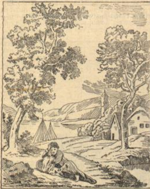
Wo ist die Schwester?

zernend, blinkend und blendend — das Meer. Da legte ich mich zur Ruhe nieder. Vor mir lag die weite Welt, und ich sah sie an ohne Verlangen.