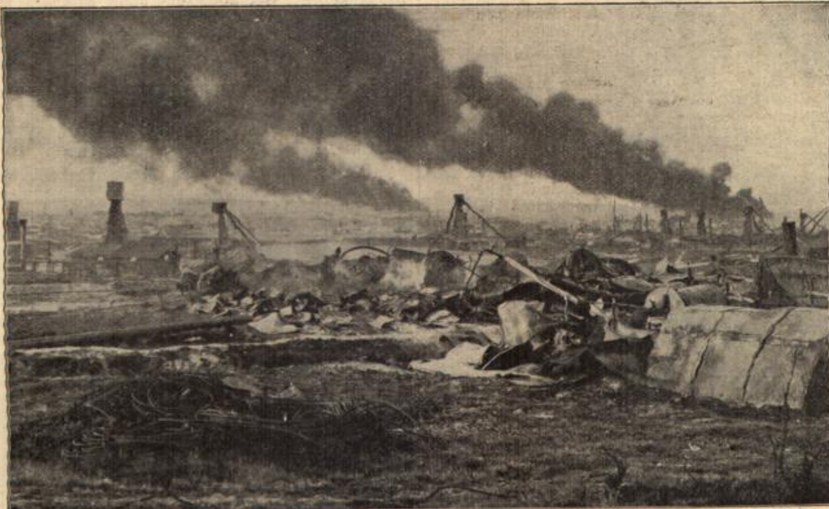
Brennende Naphthagruben in Borschtaw, im Vordergrund zerstörte Bohrtürme. (Mit Text.)

Wintertal über Gomagoi, Trafoi in 48 Windungen, von denen die letzten teilweise durch Galerien gedeckt sind, bis zu der Paßhöhe und von dort in 78 Windungen ins Braugliotal und weiter nach Bormio in der italienischen Provinz Sondrio. — Ein weiteres Bild zeigt uns noch die Gesamtansicht der Stadt Görz, in deren Nähe bisher größere