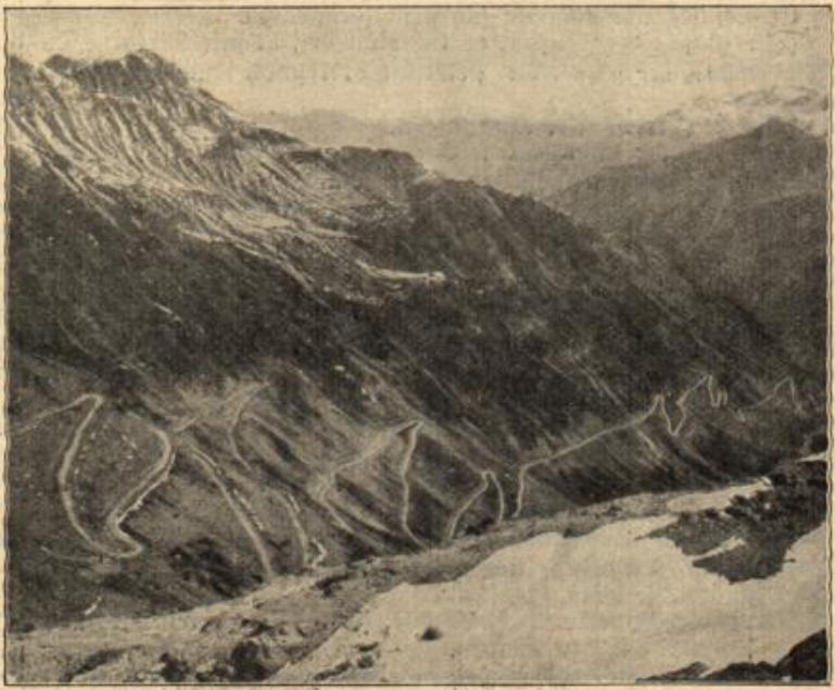
Der Übergang über das St. Gotthard. (Mit Text.)

Nach kurzer Zeit tauchte vor den scharfschauenden Blicken der Reiter als dünne Linie im grauen Nebel die Drahtleitung des