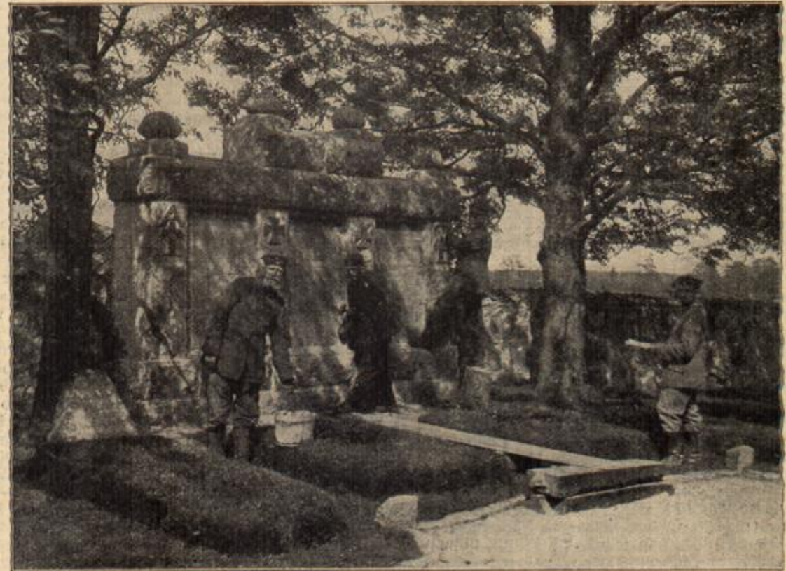
Ein deutsches Kriegerdenkmal in Rußisch-Polen.

Plöter wollte das Zweigtabel in der ersten Aufwallung mit dem Degen durchschlagen. Aber rechtzeitig dachte er noch daran, daß diese plötzliche Unterbrechung der geschaffenen Verbindung für den Feind ja das beste Warnungszeichen sei. Und es galt doch, auch den Schöpfer dieses Spionagedienstes auszuheben.