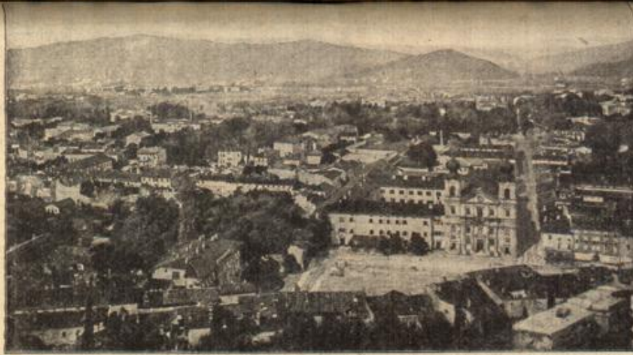
Gesamtansicht von Görg. (Mit Text.)

sichen und baldigen Verschiebung der Hauptmacht rechnen mußte. — Die Patrouille ritt an der Leitung entlang. An jedem Mast stand ein Mann in Wachstellung.