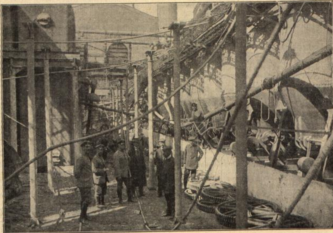
Die Ruinen der Zuckersabrik in Przeworsk, Ostgalizien, die die Russen am Morgen ihres Rückzuges in vandalischer Zerstörungslust in Brand steckten.

Hilde kam später. Tante Dörchen sah mit dem Augenschirm in der halbdunklen Stube. Sie hatte eine grobe Häfelarbeit