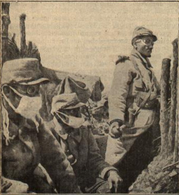
Französische Handgranatenwerfer mit Schutzmasken. (Nach französischer Darstellung.)

Am selben Tage noch wurde Rittmeister Plöter beauftragt, mit einer starken Ulanenpatrouille der Angelegenheit nachzuspüren. Rittmeister Plöter hatte schon mehrfach durch Geistesgegenwart und Kühnheit große Fähigkeit bekundet. Wenige Stunden später galoppierte er mit einem Leutnant und zwölf Ulanen aus der kleinen französischen Stadt hinaus, in welcher das Hauptquartier aufgeschlagen worden war.