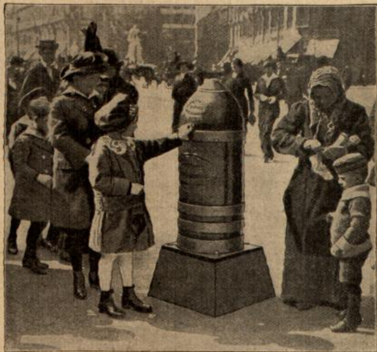
Liebegaben-Zammelbüchsen in Budapest. (Mit Text.)

Und als er im Viehwagen neben neununddreißig anderen Kameraden hodte und man durch die Fluren rollte, und kein Mensch mehr singen konnte, weil die Kehlen streiften, da packte