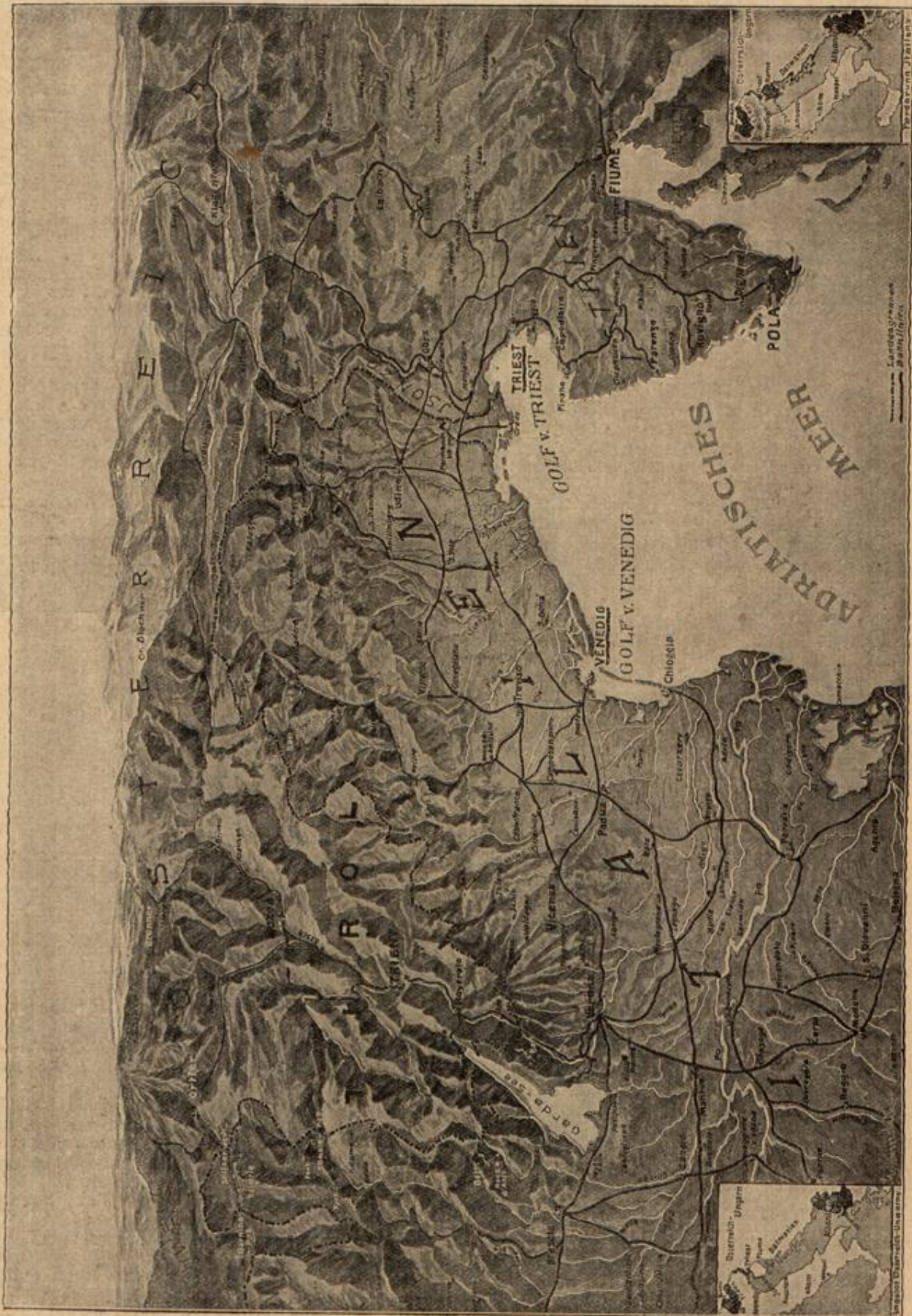
Der neue Kriegsschauplatz im Süden. Gezeichnet von Walter Emmerleben.

Und nun ging es an ein Marschieren. Sui, wie die Füße summtent! Aber wenn da fiber die Köpfe hinweg etwas anders