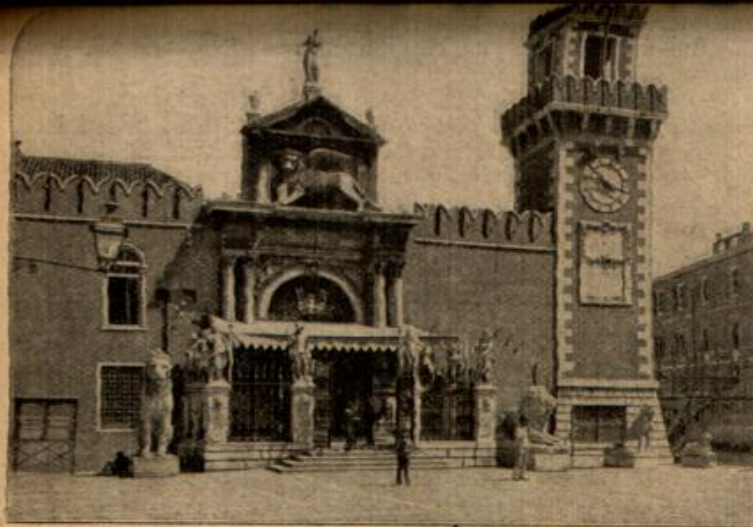
Das historische Eingangstor zum Arsenal in Venedig. (Mit Text.)

französisches Wörterbuch hatte er eine höllische Freude, aber wie er die zehn Taler entdeckte, war er betäubt. Er wusste, daß der alte Fridolin Scherer nicht auf Rosen gebettet war, und daß die zehn Taler mühsam erspartes Geld waren. Er schrieb daher flugs einen Zettel: „Mit Dank zurück, lieber, guter Magister. Ich fürchte, Petrus läßt mich nicht in den Himmel, wenn ich mit so sündhaft viel Geld angerückt komme!“ Und er legte den Zettel zum Geld, machte ein kleines Bündelchen und steckte es zu sich, hoffend, nachher beim Ausmarsch einen Bekannten an der Straße zu treffen, dem er das Bündelchen zur Rückbesorgung zum Magister nach Oberriedelbach anvertrauen könne.