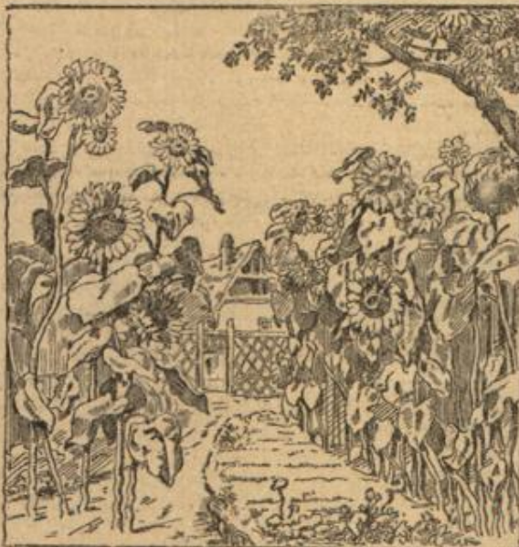
Wo steht der Gärtner?