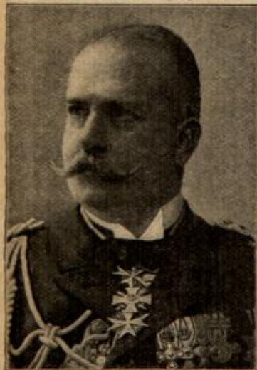
Admiral v. Ujedom-Bascha, der Leiter der Dardanellenverteidigung. (Mit Text.)