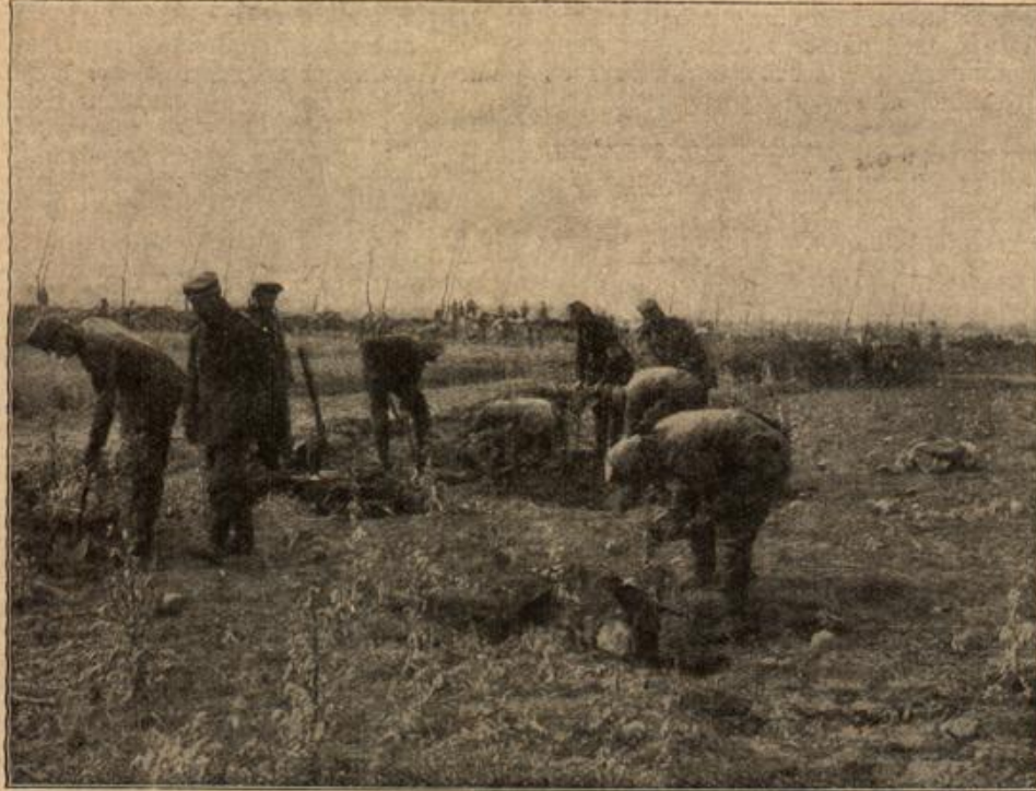
Von den französischen Schlachtfeldern. (Mit Text.)

Der Untergang des englischen Linienfahrers „Irresistible“, das von den Türken in den Dardanellenkämpfen zum Sinken gebracht wurde. Sein Schicksal teilten am gleichen Tag die englischen Linienfahrers „Afrida“ und „Ocean“, sowie das französische Linienfahrers „Douvet“. „Irresistible“, dessen Untergang unser Bild nach einer Aufnahme in „Illustrat. Lond. News“ zeigt, saßte 15 250 Tonnen; es war 122 m lang, hatte 37 Geschütze von 30,5 bis 1,7 cm Kaliber und eine Besatzung von mehr als 780 Mann. Die gleichzeitig vernichteten gegnerischen Panzer „Afrida“, „Ocean“ und „Douvet“ hatten ungefähr dieselbe Größe. Mehrere andere Panzer wurden durch schwere Treffer außer Gefecht gesetzt. Auf die „Irresistible“ folgte Ende Mai die Vernichtung der beiden englischen Linienfahrers „Triumph“ und „Majestic“, die zusammen 27 000 Tonnengehalt und Besatzungen von 1500 Mann hatten.