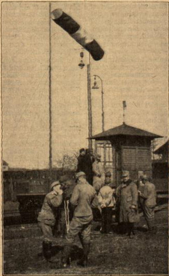
Ein losgelassener kleiner Ballon wird beobachtet und danach Windstärke und Richtung den Fliegeroffizieren der Luftschiffer-Abteilung mitgeteilt.