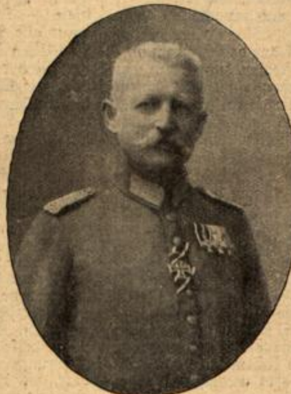
Geheimrat Prof. Dr. Richard Pfeiffer, um die Schutzimpfung gegen Cholera und Typhus verdienter Gelehrter.

Die Wände wurden tapeziert — Mühe genug kostete die Herbeischaffung des Materials — und zwar die obere Hälfte mit einer roten Rosentapete, die untere