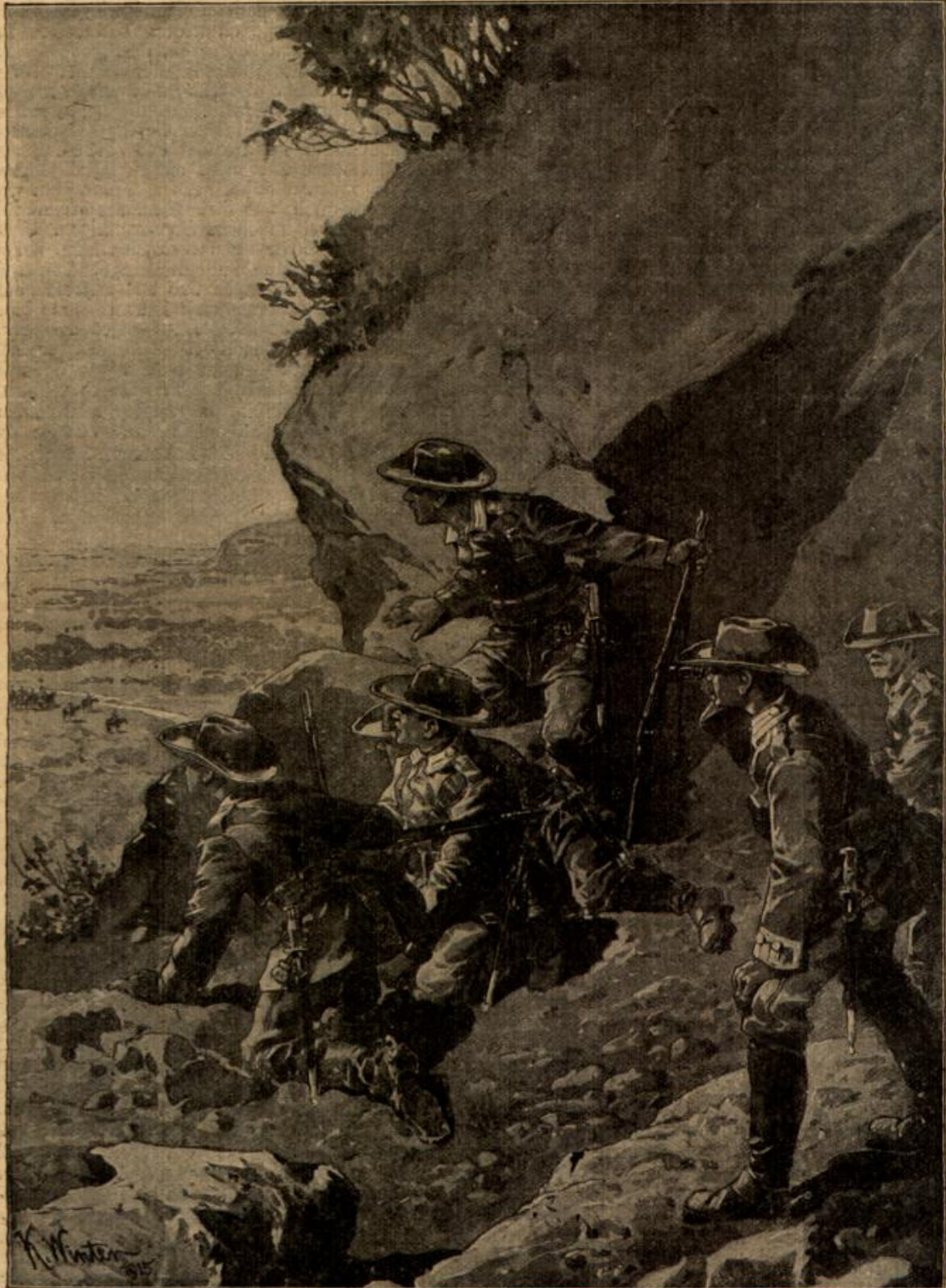
Vom Kriegshauptplatz in Deutsch-Südwestafrika. (Mit Text.)

stört auf meinen Weis. Der wildjauchzende Pöbel, den den Tropfen des 'ca ira' über den Rücken beim Scheitern tanzte, dazu megärenhafte Weiber, die bei der Plünderung der Gefallenen in Streit geraten waren, jagten mir ein Grausen ein, das ich nicht zu beherrschen vermochte. Es war für mich ein geschwächter Körper, dessen Kräfte schon die Anstrengung der Flucht völlig erschöpft hatte, zu viel des Entsetzens. Da fiele