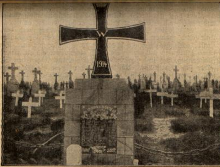
Sinniges Friedhofsdenkmal für gefallene deutsche Soldaten. (Mit Text.)

betätigen konnten. Auch hier verlangte das deutsche Gemüthsbedürfnis sein Recht. Und so war es denn kein Wunder, wenn man in diesen Wohnungen aus zererschossenen, verlassenen Siedelungen stammende Tische, Stühle, Betten, wohl auch Sofas und Sessel antreffen konnte, die ein sehr hübsches Bild boten.