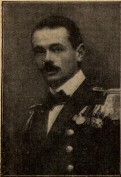
Minenschiffleutnant Ritter v. Trapp, Kommandant des österr.-ung. Unterseebootes U 5, (Mit Text.)

sein Grabenteil aus einer für die Ewigkeit ansehnend hergestellten alten Römerstraße bestand. Die Wände des Schützengrabens wurden durch schier undurchdringliches Mauerwerk gebildet, das höchstens einer gehörigen Dynamitladung gewichen wäre. Und zu diesem Mittel konnte, obgleich