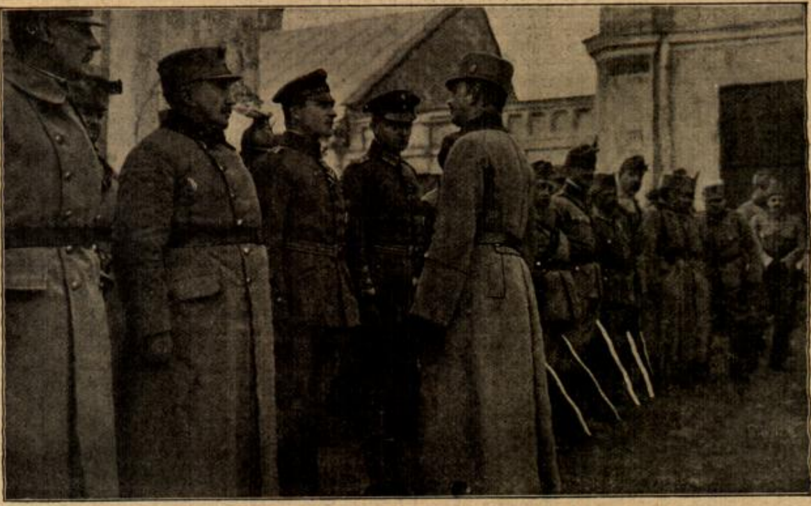
Erzherzog Karl Franz Joseph, der öste reichlich-ungarische Thronfolger, läßt sich verdiente österröchlische und deutsche Offiziere vorstellen. Unsere Aufnahme zeigt ihn in der Unterhaltung mit zwei deutschen Illiegersoffizieren.