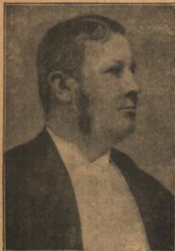
Dr. Alexander Wetere, der bereits viermal ungarischer Ministerpräsident war. (Mit Text.)