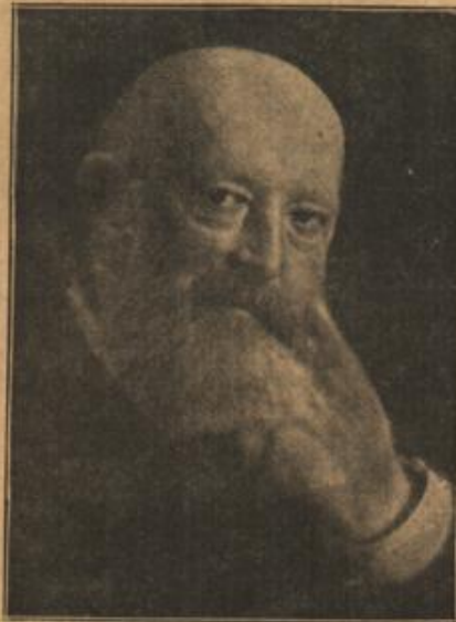
Chem. Rat Prof. Adolf Ritter v. Baeyer, der Altmeister der chemischen Forschung. (Mit Text.)

Gleich einem zudenden Blitzstrahl waren die sich überstürzenden weltgeschichtlichen Ereignisse auch in das behagliche Idyll auf dem Rittergut Greifenau gefahren. Doch nicht um alles in der Welt hätte der Baron, ein Soldat von altem Schrot und Korn,