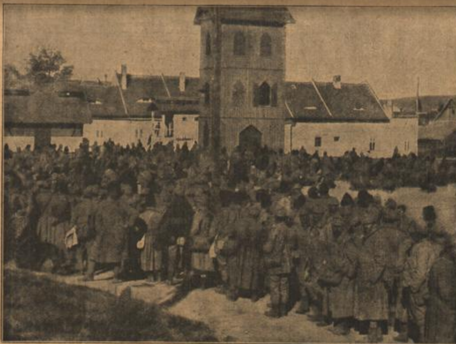
Abtransport gefangener Rumänen und Russen aus den Kämpfen in der Moldau.