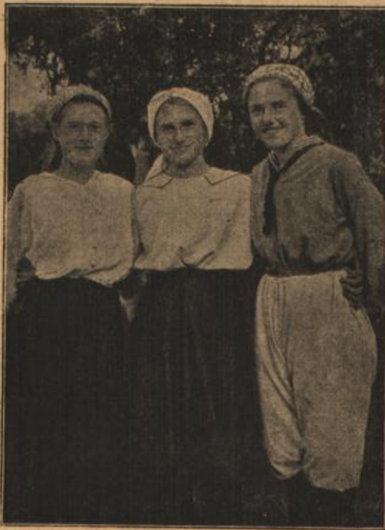
Deutsche Frauen im Weltkriege. (Mit Text.)

„So, liebes Fräulein, jetzt ist's genug“, ließ sich soeben, als die Erzieherin das seelenvolle Ave Marie aus Faust' von Gounod beendet hatte, in väterlichem Tone die Frau Baronin vernehmen. „Mein Mann wartet schon mit Schmerzen darauf, mit Ihnen noch eine Lanze im Schachturnier zu brechen.“