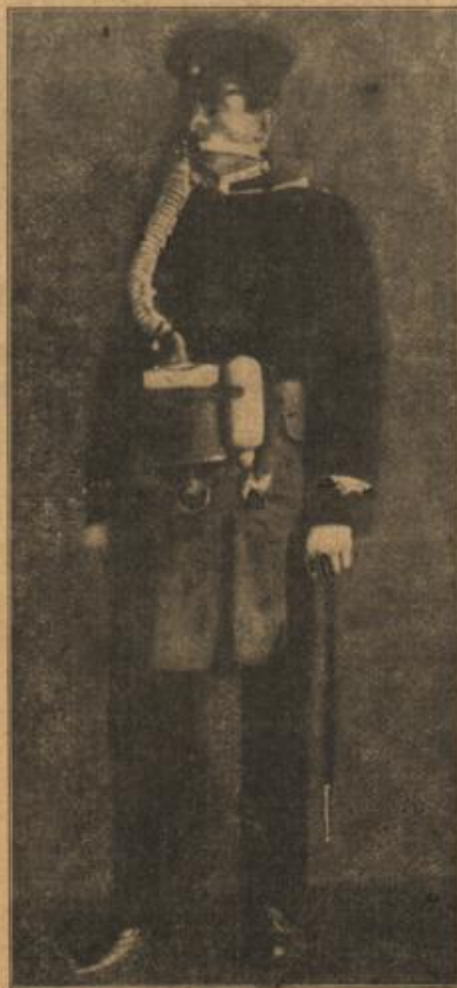
Gasmasken für Schutzmänner.

Es hieße ein unvollständiges Bild entwerfen, wenn nicht