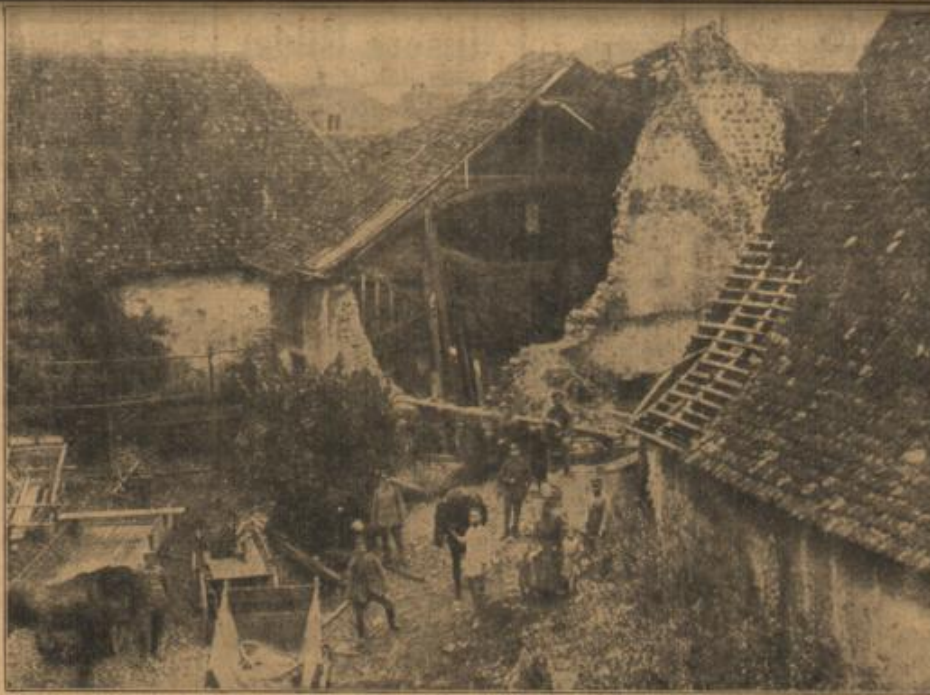
Zerschossener Bauernhof im Oberelsaß.

auch auf die niedlichen Füßchen, die schneeweißen Zähne, die beim Lachen und Sprechen hinter den Lippen sichtbar wurden, auf die schlanken, aristokratischen feinen Hände und die vornehme, geschmeidige Gestalt hingewiesen würde.