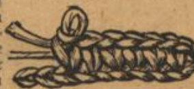
Gehäkeln des Bindfadens zum Hosenträger.

4. Reihe: zurück wie oben, aber nur 30 Maschen. Nun schneidet man das Garn ab und beginnt neu mit 30 Luftmaschen, befestigt diese da, wo vorher aufgenommen wurde, und nimmt den Bindfaden mit zurück, indem man in jede der 30 Luftmaschen sticht. Am Ende wieder 1 Luftmasche und zurück bis zu 17 Maschen vor dem Ende. Hier werden 7 Knopflöcher wie vorher eingearbeitet. 5. Reihe: zurück bis 26 Maschen vor dem Ende, wieder 3 Knopflöcher. 6. Reihe: nochmals genau so bis zum Ende, und die Hälfte des Hosenträgers ist fertig. Den zweiten Teil arbeitet man ebenso, alle Bind- und Garnfäden sind gut zu verstecken. Beide Teile messen 88 cm und sind an der im Rücken freuzenden Stelle mit Bindfaden zusammenzunähen; der Bindfadenstich und vor allem die Enden sind dann noch mit Garn zu umstechen.