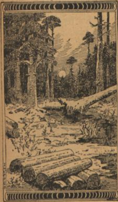
Wo ist der alte Holzschläger?

„Da haben Sie recht, Fräulein,“ erwiderte die Baronin, „nirgends ist der Anschauungsunterricht so sehr am Plage, als gerade hier und nirgends klaffen — selbst in gebildeten Kreisen — oft größere Lücken, als in der Kenntnis und dem Verstehen der Vorgänge in der Natur.“