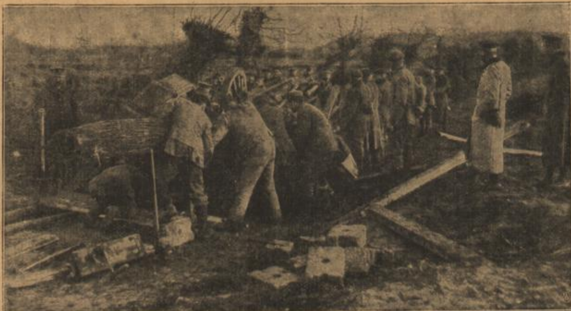
Aufmontieren eines Schingeschützes. (Mit Text.)