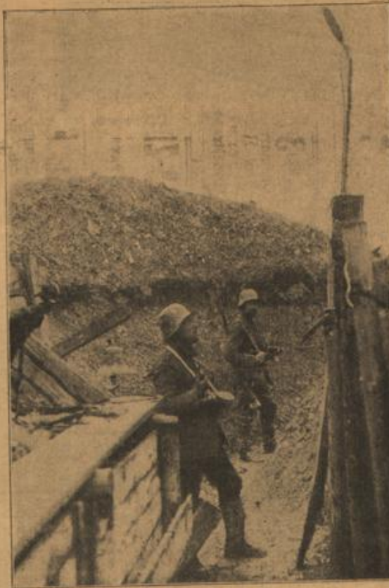
Posten am Geländespiegel und Grabenpatronille.

„Aber ich bitte Sie, liebes Fräulein, wenn Ihnen die Mitteilungen so nahe gehen, wollen wir dieselben vorerst auf sich beruhen lassen,“ rief teilnahmsvoll die Ba-