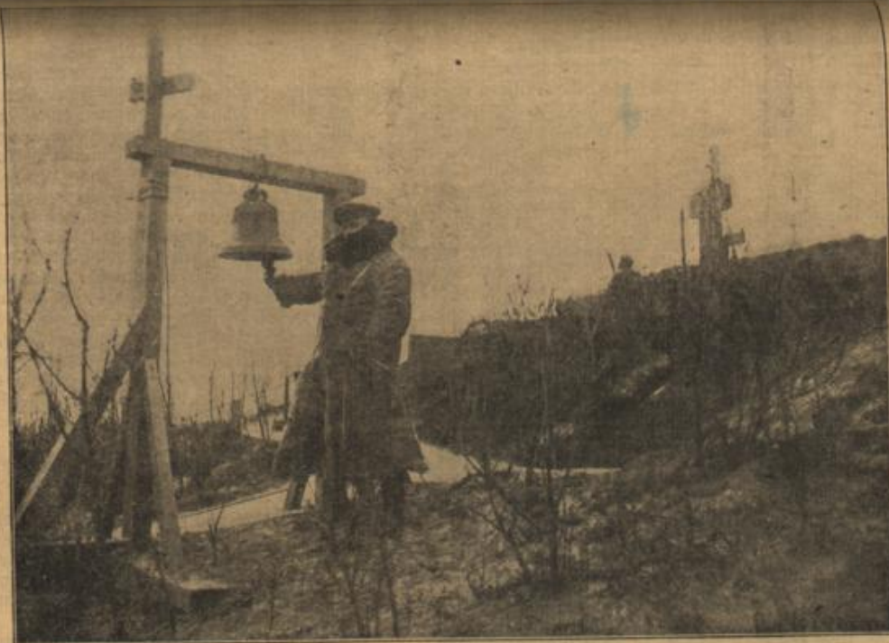
Alarmglocke an der Küste für unsere Ballonabwehrkanonen zur Meldung, sobald feindliche Fliegergeschwader in Sicht kommen.

„Sie urteilen zu streng, Herr Doktor“, sprach Elfriede. „Diese alten Brände bestehen nun einmal und man setzt sich nicht gerne darüber hinweg. Ich gebe freilich zu, daß es schlecht um das Andenken eines Verstorbenen stehen würde, wenn nur die schwarze Kleidung oder der Flor um Hut und Armel das Leid bekunden müßten; jedoch ich finde, das Dunkle paßt besser zur Stimmung, die uns erfüllt, wenn uns ein Liebes gestorben ist. Und bei uns Deutschen ist Schwarz nun einmal die Farbe der Trauer.“