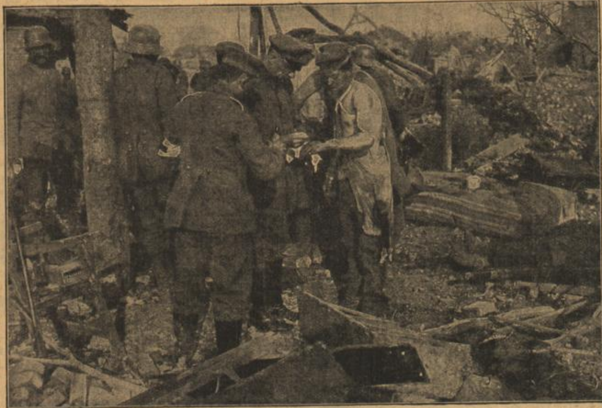
Von der Schlacht im Westen: Verbandstelle im Winkel eines heißumstrittenen Ortes vor Arras.

jetzt. Aber Tante Martha stand in all ihrer einfachen Natürlichkeit in diesem Reichtume, und auch die beiden Brüder Siebenwart, besonders Paulsrit, bewegten sich in so schlichter und selbstverständlicher Weise in diesem Leben, daß sie bald ihre Sicherheit wiedergewann. Es war bei allem Reichtum und bei aller Vornehmheit nichts Ubertriebenes, nichts Geschmackloses in ihrer Umgebung, und das wirkte