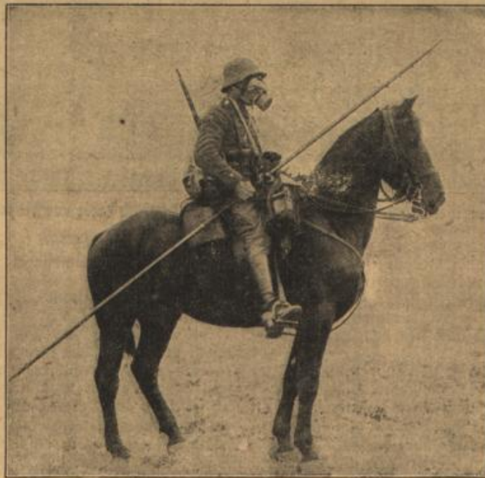
Ein deutscher Melde-Reiter mit Gasmaste.

Die Brüder richteten während des Essens verschiedene Fragen an Elfriede wegen ihres Onkels und seiner letzten Tage. Freilich mehr aus Höflichkeit, denn sie hatten den verstorbenen Gynäkologendirektor kaum vom Sehen gekannt. Im übrigen verlief das Mittagmahl ziemlich schweigsam. Karl Rudolf aß wie immer hastig; er betrachtete das Mittagessen als