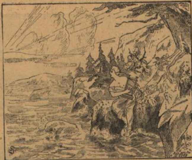
Wo ist der Fischer?

Die Zeichnung in dem Bilde des deutschen Tauchboot-Minenlegers besteht aus: 1. Kettenlast. 2. Anker. 3. Plutventile. 4. Minenrohre. 5. Preßluftflaschen. 6. Botmaschine. 7. Ventilator. 8. Turm mit Schrohr und Teleskopmast. 9. Zentrale. 10. Wohnraum. 11. Elektrischer Kraftsammler. 12. Maschine. 13. Schalldämpfer. 14. Wasserballast. 15. Ballastkiste.