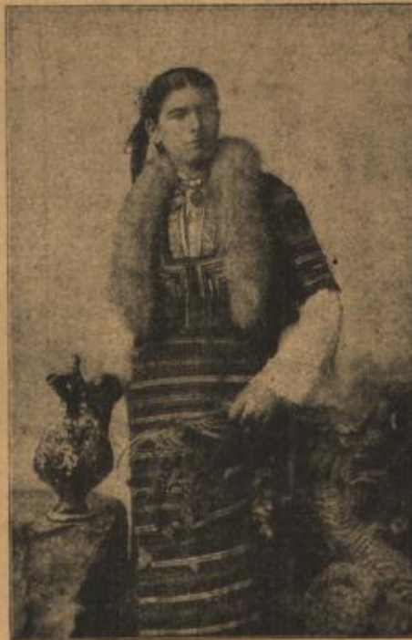
Bulgarin in Nationaltracht.

Lange, lange stand er noch an der Ruine und das Herz pochte ihm in wilden Schlägen. Er liebte zum erstenmal in seinem Leben.