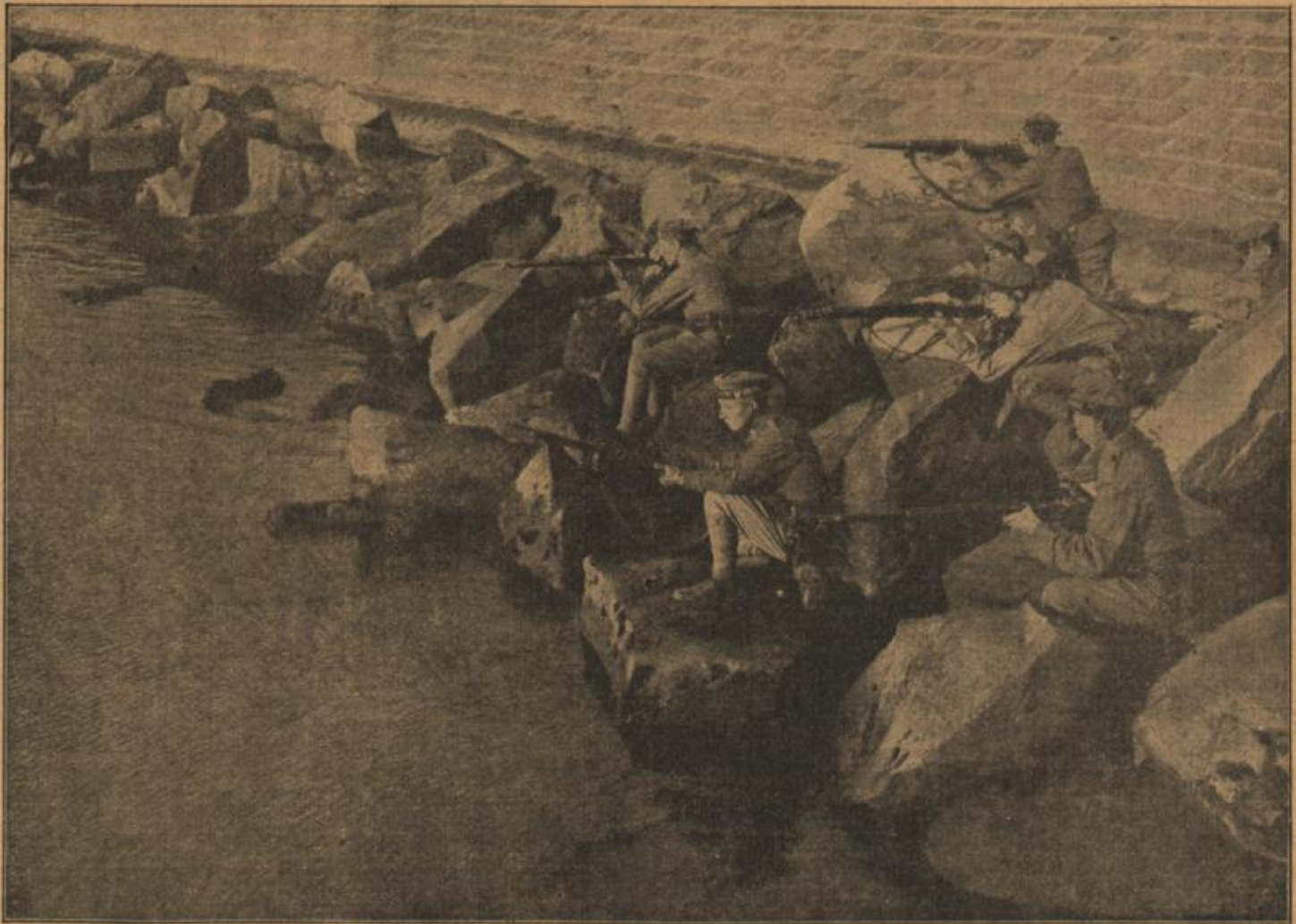
N. u. I. Marinejüngschützen auf der Jagd nach treibenden Wienen an der adriatischen Küste.

Sie ließ ihre Blicke ängstlich über das Feld schweifen, ob nicht etwa Leute dort seien, die sie beide beobachteten. Das könnte