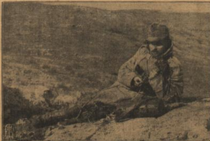
Österr.-ungarischer Telephonist auf weit vorgeschobenem Posten an der Serethfront.

Sie fügte sich und fühlte sich so maßlos glücklich an seiner Seite. Von seiner Heimat in Westpreußen erzählte er ihr, von