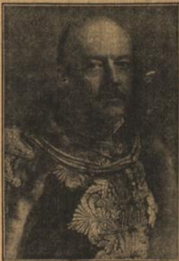
Graf Leopold Berchtold, wurde zum Oberstkämmerer Kaiser Karls ernannt. (Mit Text.) K. u. k. l.