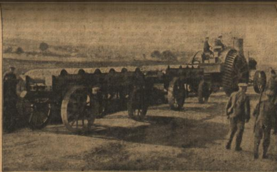
Von der Westfront: Großkalibrige englische Geschosse werden mittels Straßenlokomobile befördert.

von der Verwundung, nur mit dem Reiten ging es noch nicht recht. Seit acht Tagen lag sein Regiment, das große Verluste gehabt, hier auf deutschem Boden, nicht fern der französischen Grenze, in Ruhe. Das alles erzählte er mit einer ihm sonst ganz und gar nicht eigenen Beredsamkeit. — Ehe denn der Wagen kam, wußte er auch über Ingeborgs Reisezweck Bescheid.