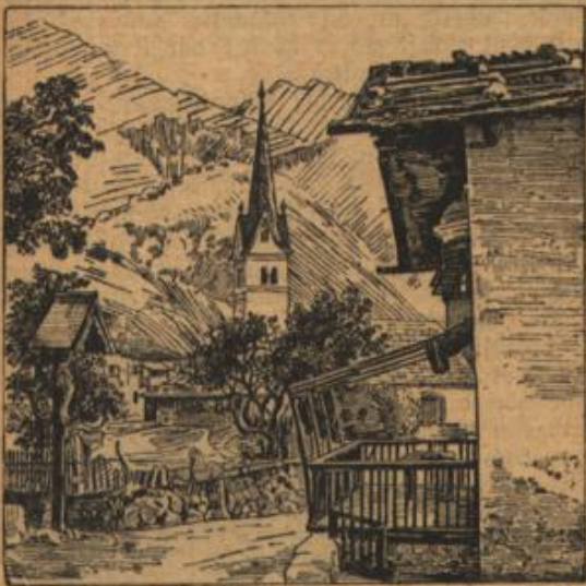
Wo ist die Wirtin?

„Ich danke schön! Trintgeld nehme ich nicht an.“