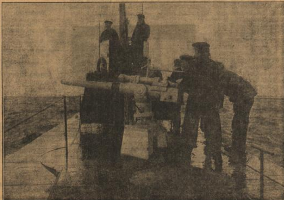
Am Schnellfeuergeschütz eines deutschen U-Boots.