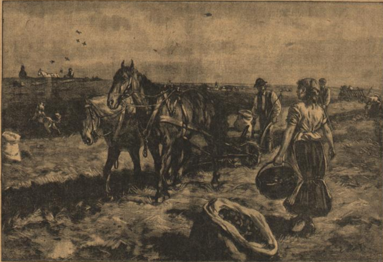
Kartoffellegen. Von E. Henseler.

er sich, schaute sie voll an mit seinen tiefblauen Augen und antwortete in verbindlichem Ton: „Bis zum nächsten Dorf ist es eine halbe Stunde, gnädiges Fräulein.“ „Und in dem Dorf liegt jedenfalls viel Einquartierung, so daß an ein Unterkommen nicht zu denken ist“, fuhr sie fort. „Allerdings eine mißliche Sache. Es liegt ein ganzes Regiment in dem Restlein. Aber der Zug erreicht vor Mitternacht bestimmt noch Mey. Dorthin wollen gnädiges Fräulein doch wohl fahren?“ „Nein, nicht bis Mey. Ich muß vorher umsteigen. Mein Reiseziel ist Schloß Rittersau.“ „Ah, Schloß Rittersau!“ Ein Leuchten ging über des Leutnants wettergebräuntes, energisches und doch so gutmütiges Gesicht. „Das ist ja gar nicht so weit von hier — Luftlinie gerechnet. — Im, Friedrichswalde liegt zwanzig Minuten vom Schloß entfernt. Und dort muß ich heute noch hin.“ Die letzten Worte sprach er mehr zu sich selber, dabei des schönen Mädchens zierliche Gestalt mit seinen Blicken umfangend, als schau er ein Märchenwunder. Er überlegte. — Diesem reizenden Wesen da einen Ritterdienst erweisen zu dürfen, das müßte doch ein Hochgefühl sein. Die Kleine würde ihm sicher sehr dankbar sein, denn er täte ihr einen großen Gefallen. Was machte es denn auch für ihn aus, wenn er statt um zehn Uhr, wie geplant, schon jetzt bei Tage nach Friedrichswalde fährt, um dort Befehle vom Brigadestab zu empfangen? Das kleine Fest-