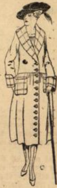
Nr. 19459. Danziger Mantel mit farbigen Knöpfen.

Es handelt sich hierbei um Mindestleistungen der Krankenkassen. Die Kassensatzung kann das Wochengeld bis zur Höchstgrenze von 7/8 des Grundlohnes erhöhen.