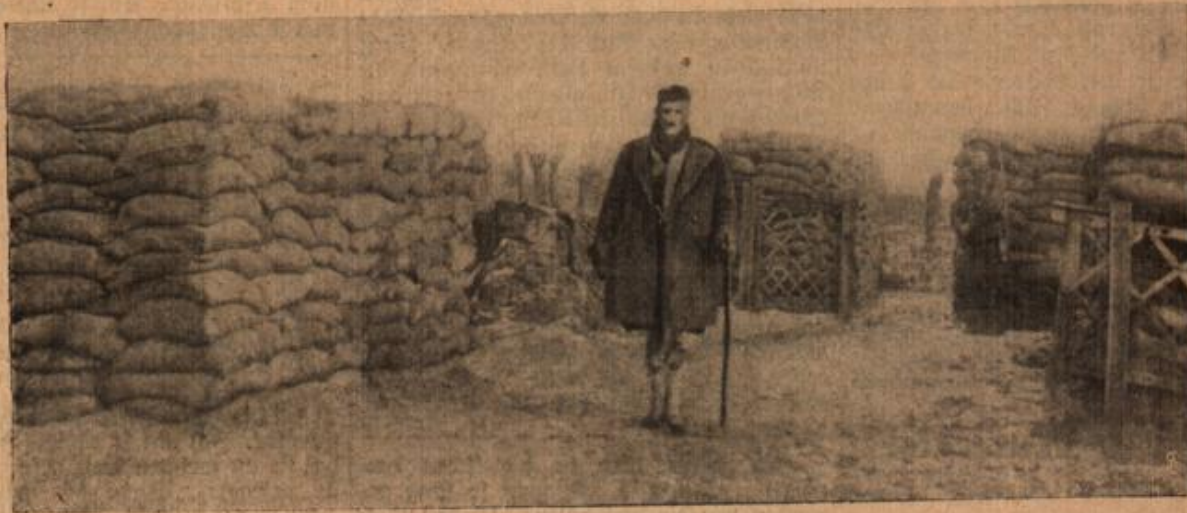
Von Engländern angelegtes besetztes Lager in Flandern.

zweite Bild, das vom Kriegsschauplatz in Flandern stammt, wo uns auf feindlicher Seite vielfach englische Soldaten gegenüberstehen. Die Söhne Albions haben sich hinter der Front ein Lager angelegt, das sie durch