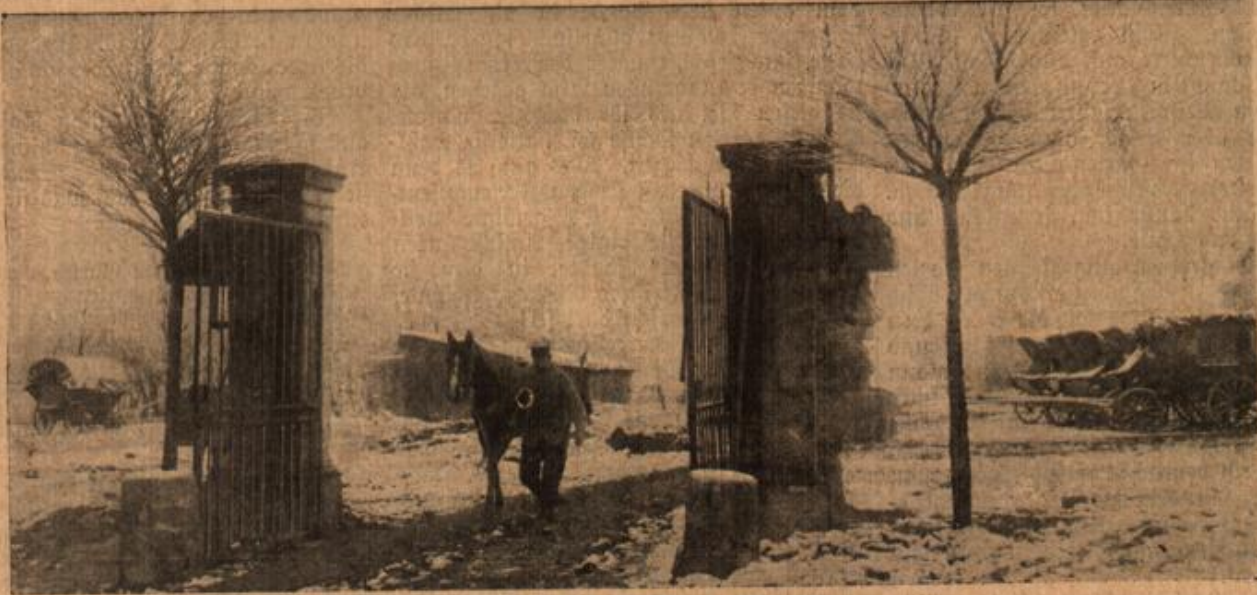
Zerschossenes französisches Gehöft, nördlich von St. Mihiel.