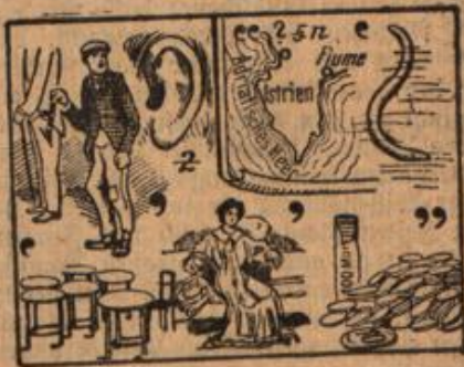
(Auflösung folgt in nächster Nummer.)

Die verräterische Kuh. Eine Abteilung Feldgrauer wurde in einem unbewohnten Dorfe untergebracht. In einem Hofe waren Kühe zum Schlachten eingetrieben. Da lief in der Nacht eine derselben in einem Hintergebäude die Treppe hinauf und geriet in eine Kammer. Von der gewaltigen Last aber brach der Boden ein, und unter demselben entdeckten die Soldaten zu ihrer Freude einen reichen Vorrat an Wein, Mehl und Getreide, dessen Zugang von außen gut vermauert war.