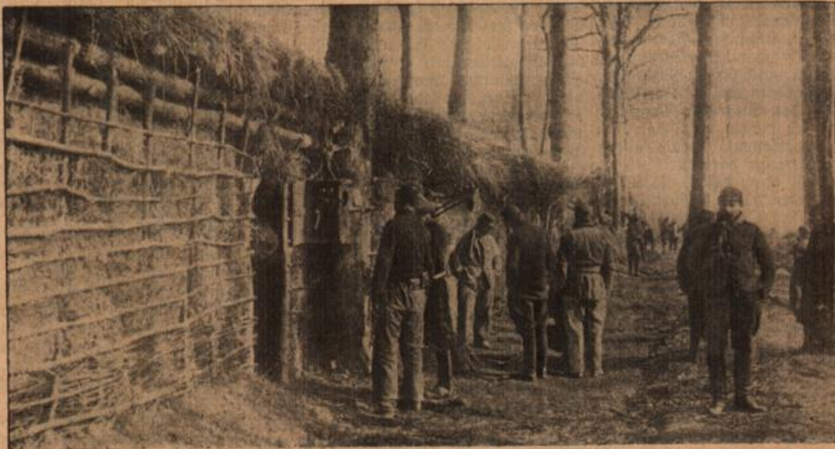
Französische Befestigung auf den Maashöhen.

behaglich sich einer wohlverdienten Ruhe hingeben können. Im Vordergrund an dem Baum sehen wir ein Telefon, durch das den ruhenden Truppen die Befehle der Kampfesleitung übermittelt werden können. Eine ganz anders geartete Befestigung zeigt uns das