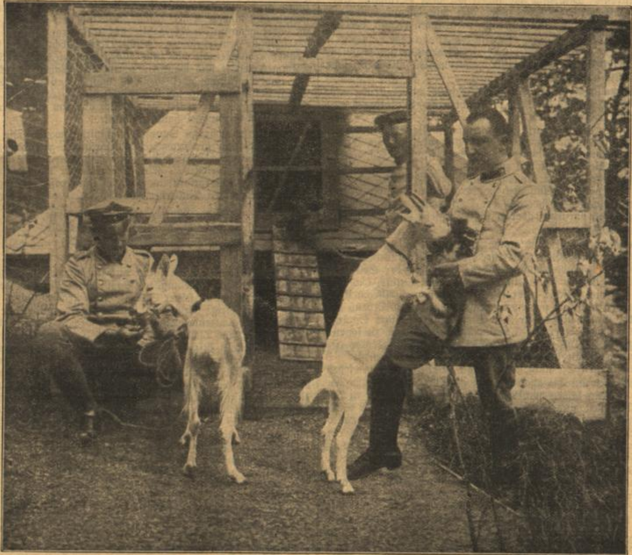
Idyll hinter der Front.

Wöchentliche Beilage zu zahlreichen angesehenen deutschen Zeitungen. * 30. Jahrg. Expedition und Annoncen-Aannahme: Charlottenburg bei Berlin, Berlinerstr. 40. (Auch durch alle größeren Annoncen-Bureaus.)