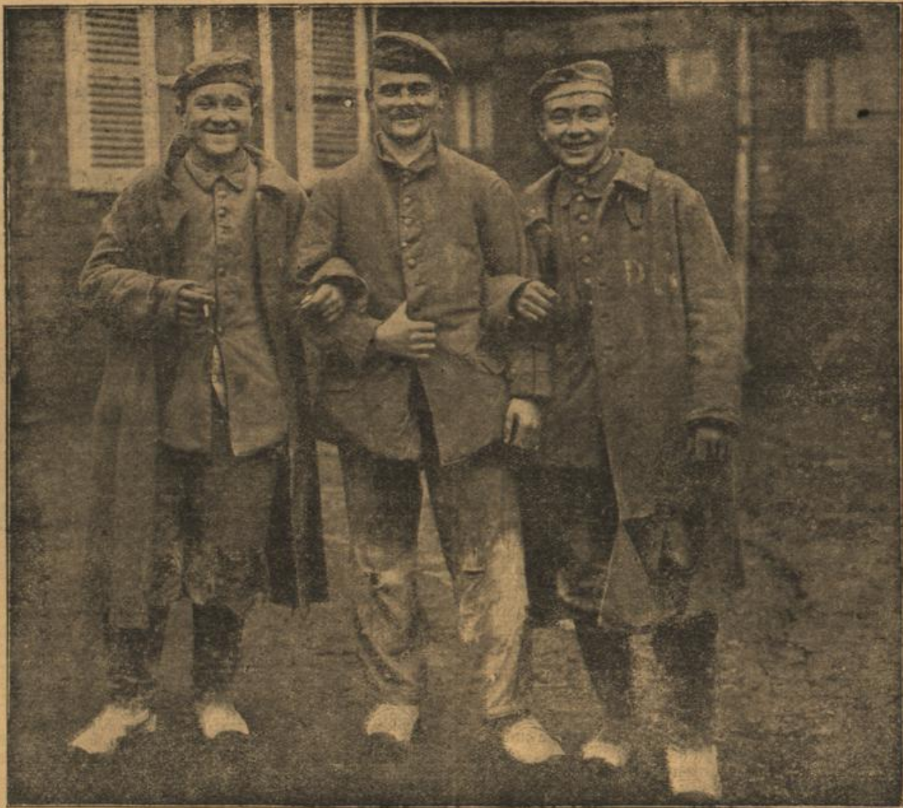
„Drei Flüchtlinge“ in der Champagne. Diese Feldgrauen sind aus der französischen Gefangenschaft entwichen und wieder bei ihrem Truppenteil eingetroffen. Sie wurden bei den letzten Kämpfen in der Champagne gefangen genommen und konnten durch List sich wieder befreien. Auf dem Mantel des Rechtsstehenden ist deutlich der Stempelauddruck als französischer Gefangener erkennlich.

Wöchentliche Beilage zu zahlreichen angesehenen deutschen Zeitungen. * 30. Jahrg. Expedition und Annoncen-Annahme: Charlottenburg bei Berlin, Berlinerstr. 40. (Auch durch alle größeren Annoncen-Bureaus.)