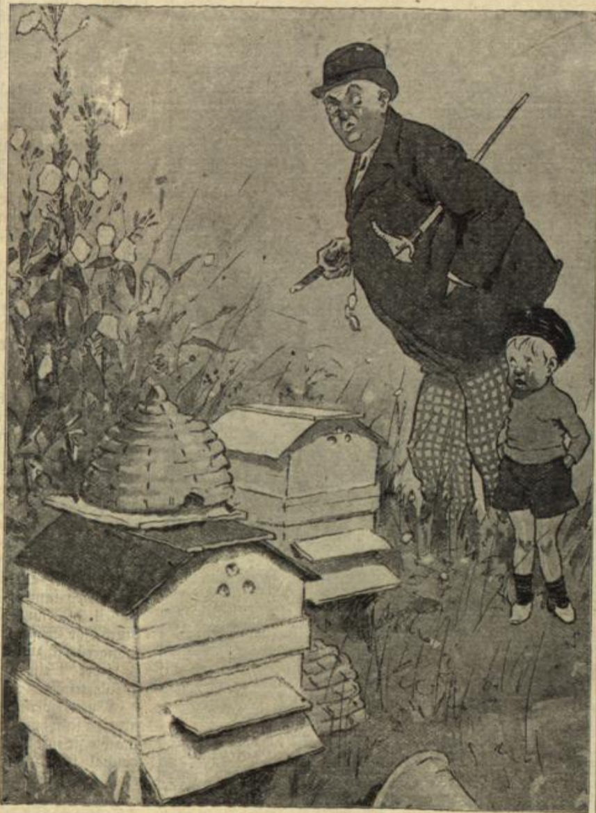
Onkel: Was lehren uns die emsigen Bienen? Neffe: Nicht zu nahe heranzugehen.