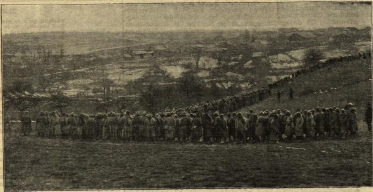
Der Zug der bei Ripont in der Champagne gefangenen Franzosen.

kommen Ihnen in jeder Weise entgegen. Das Wahlrecht kann ich Ihnen ja nicht versprechen, aber eingebracht soll die Vorlage werden. Die liberale Partei wird im nächsten Parlament Gelegenheit haben, über