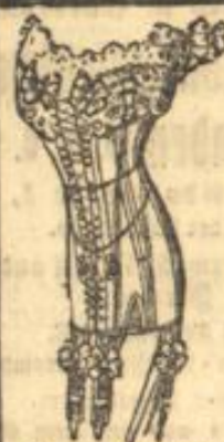
Schnur in der Mitte. Planchette etwas seitl.