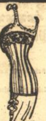
Rücken ohne Schnürung.