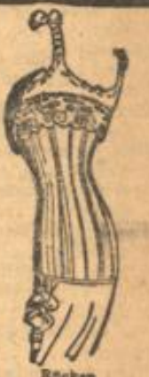
Rücken ohne Schlingung.