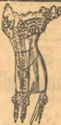
Reiner in der Mitte. Planchette etwas seitl.

Größtes Weingut am Rhein im Privatbesitz.