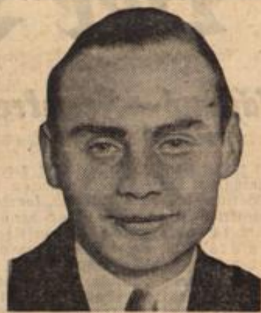
Ein Deutschgeborener wird in Amerika zweiter Schahjettretär.

Nach der Wiederaufrichtung des Deutschen Reiches am 18. Januar 1871 in Versailles wurde die schwarz-weiß-rote Flagge für die Kriegs- und Handelsmarine übernommen. Erst später, als diese Farben sich im ganzen deutschen Volke als Symbol deutscher Macht durchgesetzt hatten, wurde die Reichsflagge durch eine besondere Verordnung vom 8. Nov. 1892 zur „deutschen Nationalflagge“ erhoben. In ihr verkörpert sich nicht nur die Erinnerung an die große Vergangenheit, sondern auch das Bewußtsein von der Einheit aller Deutschen diesseits und jenseits aller Grenzen. Den unwägbaren seelischen Werten, die mit den Farben der schwarz-weiß-roten Nationalflagge untrennbar verbunden sind, ist jetzt durch die Verordnungen des Reichspräsidenten und des Reichszanlers wieder Rechnung getragen worden. C. Schmidt.