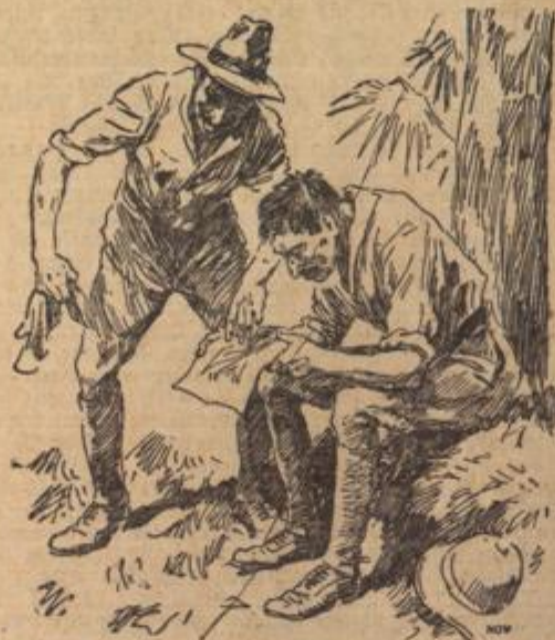
Mit dem Saft des Tewe-Baumes bestrichen sie die Zeichnung und warteten gespannt auf das Ergebnis der Prozedur.