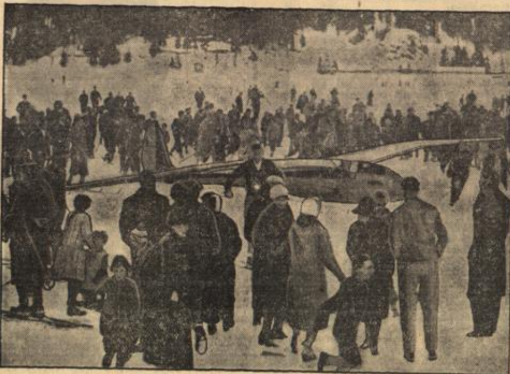
Das erste Bild vom Alpenflug des deutschen Segelfliegers Groenhoff.

Groenhoffs Anflug in Davos. Das Flugzeug des fähigen Segelfliegers wird nach der glücklichen Landung auf dem Davoser See abgeschleppt. Der Inhaber des Weltrekords im Langstrecken-Segelflug, Günther Groenhoff, hat jetzt mit seinem wohlgefügigen Alpenflug von Zürich nach Davos eine neue Höchstleistung aufgestellt. Nachdem er sich von einem Motorflugzeug auf größere Höhe hatte bringen lassen, erreichte er unter Ausnutzung der Windverhältnisse mit eigenem Steuer sein Ziel und legte die 110 Kilometer lange Strecke bei starkem Gegenwinde in zweieinviertel Stunden zurück.