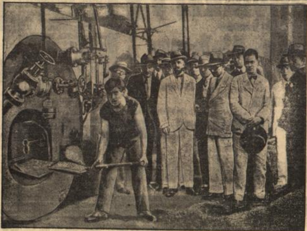
Brasilien erstickt an seiner zu guten Kaffee-Ernte.

Simsburg a. d. L., 21. Jan. Das bekannte Hotel „Fruhlicher Hof“ wird am 23. Januar zwangsversteigert. Der Eigentümer hatte vor einigen Jahren das Haus völlig umgebaut, jedoch konnte der infolge der wirtschaftlichen Verhältnisse abnehmende Fremdenverkehr die Unkosten nicht mehr aufbringen.