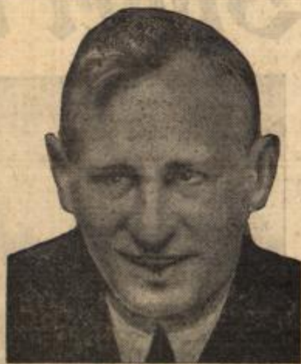
Der gefährlichste Fälschmünzer der letzten Jahrzehnte.

Auf geheimnisvolle Weise ist in der Silvesternacht eine Angehörige der englischen Hocharistokratie gestorben. Man fand sie tot auf dem Strassenbamm. Die Leiche wurde beschlagnahmt und sezziert, ohne daß man die Todesursache genau feststellen konnte. Die Kriminalpolizei begann den Bekanntenkreis der 20jährigen Aristokratin auszuforschen, und dabei machte man geradezu aufsehenerregende Entdeckungen. Das junge Mädchen, das nach außen hin ein durchaus tadelloses Leben geführt hatte, hatte es auf geradezu raffinierte Weise verstanden, ihre Eltern, ja ihre ganze Umgebung, über ihr wahres Wesen zu täuschen. Sie hatte ein Doppelleben geführt, sie hatte nachts, wenn ihre Eltern sie in tiefem Schlaf glaubten, heimlich das Haus verlassen, um in übler Gesellschaft zweifelhafteste Vortale aufzusuchen. Man fand in ihrem Schreibtisch Briefe, die bezeugten, daß das junge Mädchen Beziehungen zu verschiedenen jungen Leuten unterhalten hatte. Diese wurden von der Kriminalpolizei vernommen, konnten jedoch nur aussagen, daß sie in der Silvesternacht das junge Mädchen nicht gesehen hatten. Da der Bekanntenkreis des Mädchens sehr ausgedehnt war und sich auch auf Kreise erstreckte, die alles andere als gesellschaftsfähig sind, ist die polizeiliche Untersuchung natürlich sehr erschwert. Es wird wohl lange Zeit dauern, bis das Rätsel dieses geheimnisvollen Todesfalles gelöst ist.