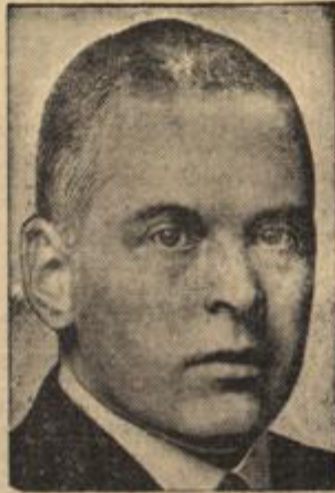
100 Jahre Gustav-Adolf-Berein.