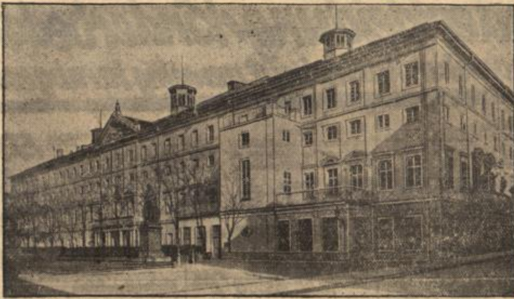
Hier wurden Schillers „Räuber“ vor 150 Jahren zum erstenmal aufgeführt.

Das Gebäude des Nationaltheaters in Mannheim, in dem Schillers Schauspiel „Die Räuber“ am 13. Januar 1782 zum erstenmal über die Bretter ging. Nur durch einen glücklichen Zufall konnte das alte Gebäude erst kürzlich vor dem Schicksal des Stuttgarter Schlosses bewahrt werden. Es gelang der Aufmerksamkeit der Mannheimer Feuerwehr, einen im Bühnengebäude an verborgener Stelle ausgebrochenen Brand in seinen ersten Anfängen zu ersticken.