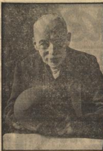
Der Konstrukteur des deutschen Stahlhelms gestorben.