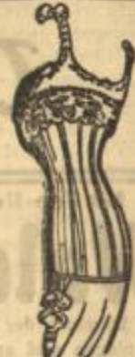
Stücken ohne Schnürung.