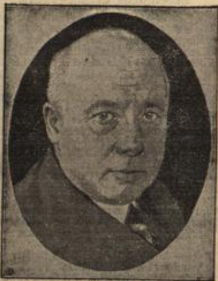
Reichsfinanzminister Dr. Moldenhauer.

Sehr begehrt ist das Finanzministerium zurzeit gerade nicht, was bei den finanziellen Schwierigkeiten des Reiches ja nicht verwunderlich ist. Die Volkspartei scheint keinerlei Neigung zu haben, es wieder zu über-