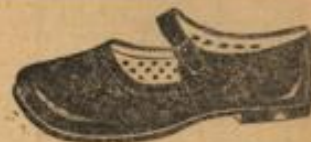
Leder-Sandalen von Mk. 3.50 an

Kinder-Stiefel in braun od. schwarz, v. 2 an Damen-weiße Halbschuhe , genähte Leder-sole . . . . . von 4 an Damen-schwarze Spangenschuhe , gestiftet . . für 3.90