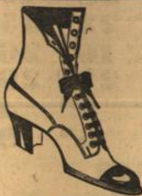
In Chevreaux od. Boxkalb

Soweit unsere noch vorteilhaft eingekauften Vorräte reichen, bieten wir in