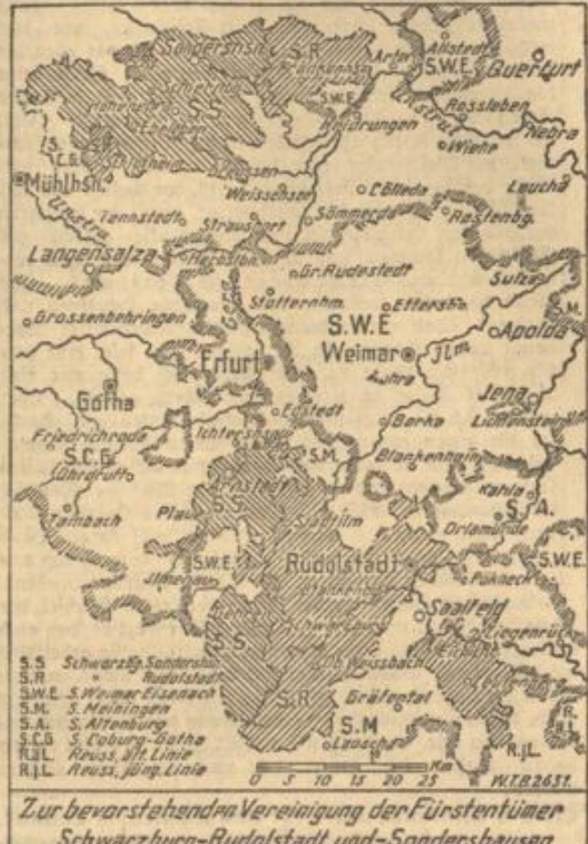
Zur bevorstehenden Vereinigung der Fürstentümer Schwarzburg-Rudolstadt und-Sandershausen

Die Preise, die bei der Beschlagnahme dem Handel von diesen Gesellschaften bezahlt werden, lassen einen Import nicht mehr rentabel erscheinen; sie sind meistens viel geringer als die Anschaffungskosten. Die Verluste, die der Handel dadurch erleidet, bedeuten eine ungerechte Besteuerung. Wir müssen auch darauf hinwirken, daß in die Vorstände dieser Monopolgesellschaften mehr als bisher Sachverständige gewählt werden. Die Golddeckung der Reichsbank ist trotz des Sommerleises aller Volksteile im Zurückgehen begriffen; jedoch ist sie noch immer so gut wie die der Bank von England und weit besser als die der Bank von Frankreich und der russischen Staatsbank. Erfreulich ist auch, daß der Kurs unserer Valuta im Ausland in letzter Zeit eine ansehnliche Stärkung erfahren hat. Das Hauptmittel, diesen Kurs möglichst hoch zu halten, ist die Förderung