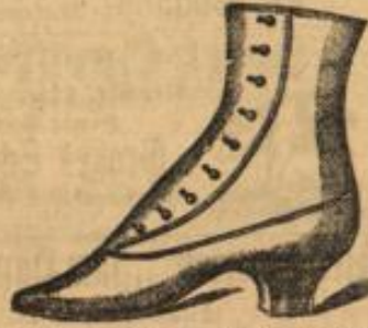
Kalbin-Knopfstiefel mit dickem, innem Pelzfutter, sehr weich und warm, für 7,50.

bietet, besagen die dafür im Schaufenster mit Preisen ausgezeichneten Paare, es wird selbst für das billigste Paar Garantie für gutes Tragen übernommen. — Herren-Schnurkiefel, als solche bewährt, unter Garantie für jedes Paar, moderne Form 6,50 bis zu den feinsten Goodgear Welt, Chevreau u. Bogcaif, Alle zu ermäßigten Preisen.