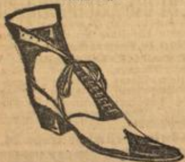
Damen-Höhenstiefel m. Lederbesatz u. Absatz für 2,75, dieselben m. Gummibeflag, auch als Schnallenstiefel, 3,95.