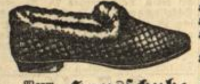
Warm gefütterte Hauschuhe mit Abfah, keinem Einfaß, in allen Damen-Größen . . . 1. 95