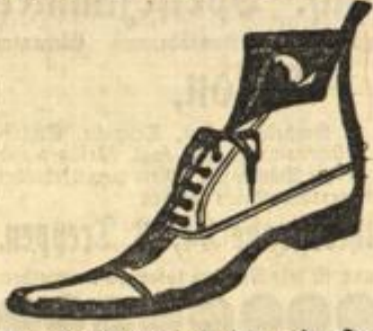
Garantie-Qualitäten in den modernsten Formen zu nebenstehenden Preisen!